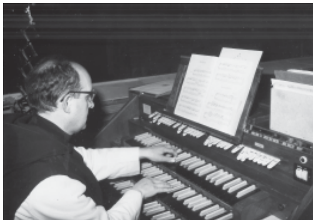
Al teclat de l'orgue de Poblet, un instrument que seria el «company» diari de tota la seva vida

El 15 d'octubre de 1961 s'inaugurà un enorme orgue per a Poblet. El nou instrument era obra de la casa Organería Española . Constava de