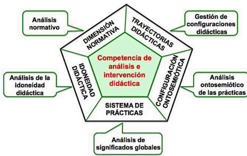
Figura n.º 1. Competencia de análisis e intervención didáctica del profesor de matemáticas. Fuente: Godino et al. (2017, p. 103)

El modelo del conocimiento del profesor propuesto en el enfoque ontosemiótico se establece según tres dimensiones como es la dimensión matemática (conocimiento matemático no necesariamente