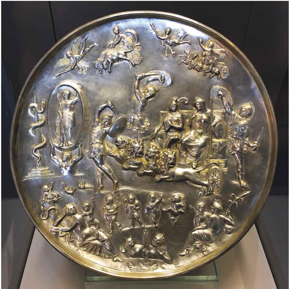
Fig. 1. Patera de Parabiago; siglo II d.C. CCCA IV, nº 268, lám. 107. Milán, Pinacoteca di Brera = Galleria Brera , nº inv. 18901.