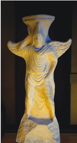
Fig. 3. Thymiaterion de terracota en forma de Atis alado procedente de Tarso; siglos II-I a. C. CCCA I, nº 838, lám. 180. París, Museo del Louvre, nº inv. T 61.