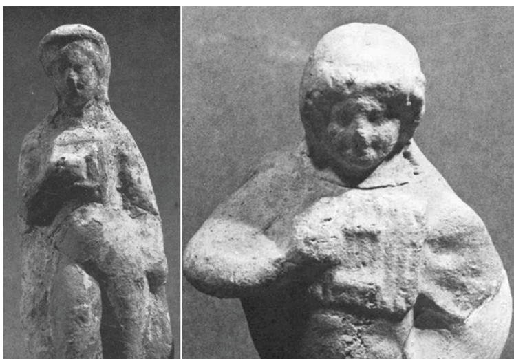
Fig. 7. Estatuillas de Atis femenino infantil, con una flauta en su mano derecha y el vientre descubierto, procedentes de las excavaciones del templo de Mater Magna en el Palatino; siglo II a. C. CCCA III, nº 35 y nº 58, lám. 36 y 48. Roma, Antiquarium del Palatino, nº inv. 9186 y 9209.