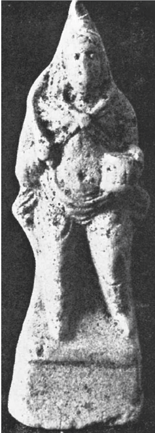
Fig. 8. Estatuilla de Atis afeminado de pie con el vientre descubierto, portando un pedum o un tympanum , procedente de las excavaciones del templo de Mater Magna en el Palatino; siglo I a. C. CCCA III, n° 12, 2, lám. 21. Roma, Antiquarium del Palatino , n° inv.: no especificado.