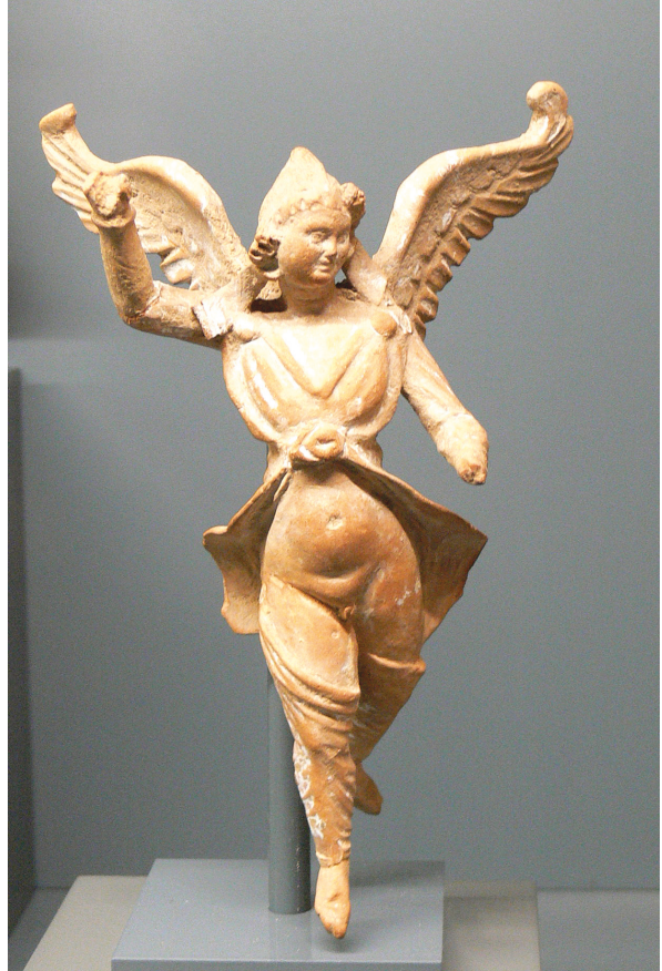
Fig. 9. Estatuilla de Atis danzarín, alado y con el vientre descubierto, procedente de Mirina; siglo I a. C. CCCA I, n° 495, lám. 109. Berlín, Museo de Pérgamo, n° inv. 8193.