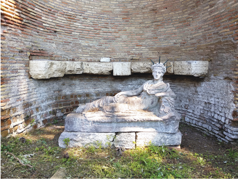
Fig. 2. Copia del Atis de Ostia situada dentro del Attideum del santuario de Mater Magna, Ostia Antica . CCCA III, nº 394, lám. 244. La escultura original se conserva en el Museo Laterano del Vaticano, nº inv. 10785.