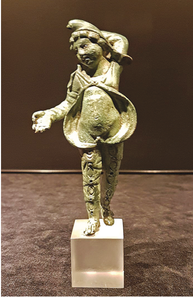
Fig. 4. Estatuilla de Atis en bronce procedente de Maastricht; siglos II-III d. C. Museo de Limburgo, n° inv. L04380.