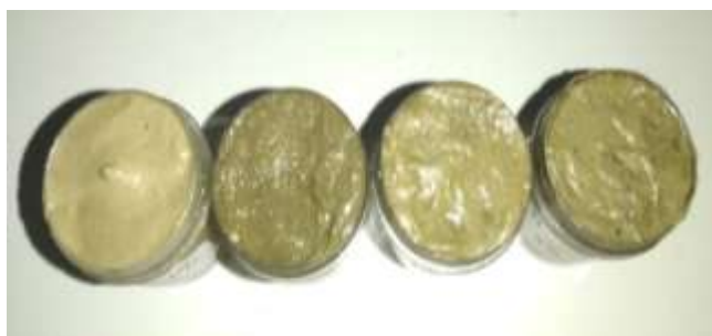
Gambar 1. Hasil Pengujian Organoleptik

Hasil pengujian organoleptik meliputi bahwa formulasi krim yang dihasilkan pada konsentrasi 1% berwarna hijau pucat memiliki bau khas ekstrak etanol daun Salam dengan bentuk semi padat, pada konsentrasi 3% berwarna hijau tua yang memiliki bau khas ekstrak etanol daun salam dengan bentuk semi padat, pada konsentrasi 6%, berwarna kecoklatan memiliki bau khas ekstrak etanol daun Salam dengan bentuk semi