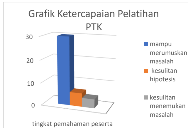
Gambar 2. Grafik Ketercapaian Pelatihan PTK

Berdasarkan hasil kegiatan pengabdian pada masyarakat ini, maka dikatakan bahwa kegiatan ini memiliki pengaruh yang sangat signifikan terutama bagi guru sejarah se Kabupaten Bogor. Ini artinya bahwa mereka telah memiliki pengetahuan baik secara teoritis dan praktik untuk melakukan penelitian tindakan kelas, sehingga diharapkan mereka akan menjadi guru yang profesional yang memiliki kompetensi pada bidangnya.