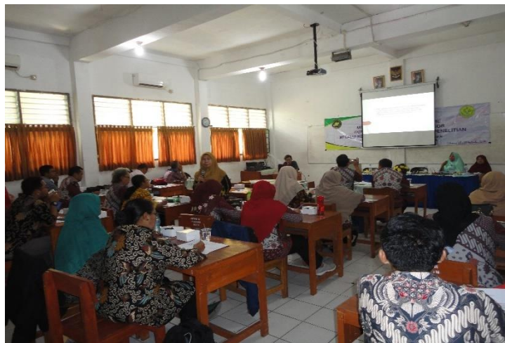
Gambar 2. Narasumber memberikan pertanyaan lisan dalam kegiatan pelatihan.

perumusan masalah. Hal ini diketahui dari jawaban pertanyaan lisan narasumber pada beberapa peserta pelatihan dari setiap kelompok. semua kelompok dapat menjawab pertanyaan dari narasumber dengan benar. Dengan demikian dapat disimpulkan bahwa kegiatan pelatihan ini berhasil mencapai tujuan, yaitu guru sejarah mampu menyusun proposal penelitian PTK dengan benar.