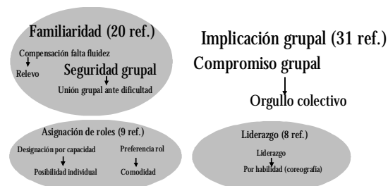
Figura 3. Mapa de las principales ideas extraídas de las categorías familiaridad, implicación grupal, asignación de roles y liderazgo.

En la figura 3 se han detallado los resultados más relevantes de las otras tres categorías del estudio. De la misma manera que en la anterior figura, el tamaño de las letras es más o menos proporcional con el número de referencias codificadas.