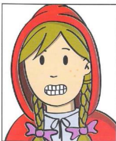
Enseñar los dientes