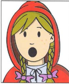
Abri la boca

1. Haz un círculo en las imágenes que has practicado, en las que no realiza una X.