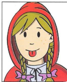
Sacar la lengua