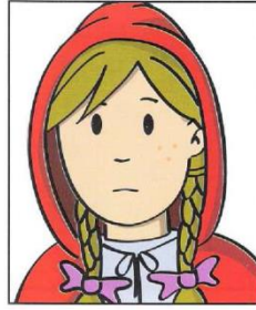
Cerrar la boca