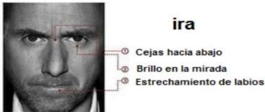
Imagen 5: Expresión facial de la emoción de la Ira.

Esta emoción se aprecia cuando los labios permanecen: o cerrados y en tensión con las comisuras bajas o rectas y la mandíbula apretada, o abiertos y tensos dejando ver mínimamente los dientes; las cejas suelen estar bajas, contraídas y arqueadas con un ángulo menor en la parte interior; además aparecen unas líneas verticales entre ceja y ceja; el párpado superior se encuentra tenso y puede estar bajo por la acción de las cejas; el párpado inferior está tenso también y puede o no estar elevado; y finalmente la mirada de los ojos puede achinarse o no, también puede existir una mirada fuerte y las pupilas pueden estar dilatadas.