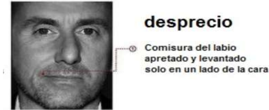
Imagen 7: Expresión facial de la emoción del Desprecio.

En cuanto a la expresión facial la emoción mencionada se produce cuando alguien levanta y aprieta el labio en un solo lado de la cara; a veces se puede levantar una sola ceja a la vez que los ojos se ponen en blanco; y finalmente, y aunque no sea algo característico de la expresión facial, se produce un tono en la voz sarcástico y duro hacia el otro.