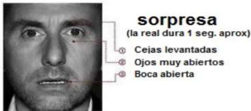
Imagen 4: Expresión facial de la emoción de la Sorpresa.

En cuanto a las expresiones faciales de la región inferior, la mandíbula permanece abierta, haciendo que los dientes y labios de arriba y abajo respectivamente estén separados. No obstante, no hay tensión de la boca. Si hablamos de la parte superior de la cara, los párpados aparecen abiertos, de manera que el superior está levantado y el inferior bajado, ambos dos en tensión; los ojos permanecen tan abiertos por el asombro que se ve el blanco del ojo por encima del iris; además, las cejas se elevan formando un arco debido a su curvatura; y, por último, se forman arrugas horizontales en la frente por la contracción del músculo frontal.