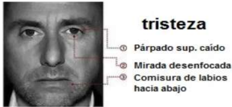
Imagen 3: Expresión facial de la emoción de la Tristeza.

Es muy común en esta emoción querer ocultar nuestras expresiones faciales a las personas que nos rodean, probablemente a causa de la vergüenza que nos provoca que nos vean en ese estado de tristeza acompañado del llanto.