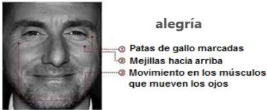
Imagen 1: Expresión facial de la emoción de la Alegría. Fuente: Capino, 2012.

definen en la cara de una persona lo que es la alegría. Así pues, las comisuras de los labios también se elevan, la boca puede o no estar abierta a la vez que puede o no enseñar los dientes. También existe otro gesto que se encuentra en el pliegue naso-labial. Cuando sonreímos, la parte que se encuentra entre el labio superior y la nariz se distiende y hace que haya menos espacio entre la nariz y la boca.