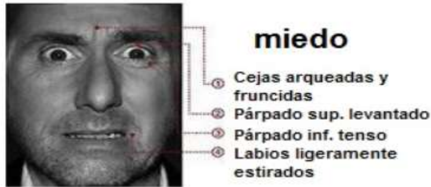
Imagen 2: Expresión facial de la emoción del Miedo.

En cuanto a la expresión facial, el miedo se asocia en la región superior con las cejas levantadas y contraídas al mismo tiempo; el párpado superior elevado y el inferior en tensión; y en la frente las arrugas que surgen lo hacen en el centro. En relación con la región facial inferior, los labios se retraen y se tensan (Figueroba, s.f.). La boca puede estar cerrada o abierta, o entreabierta enseñando los dientes.