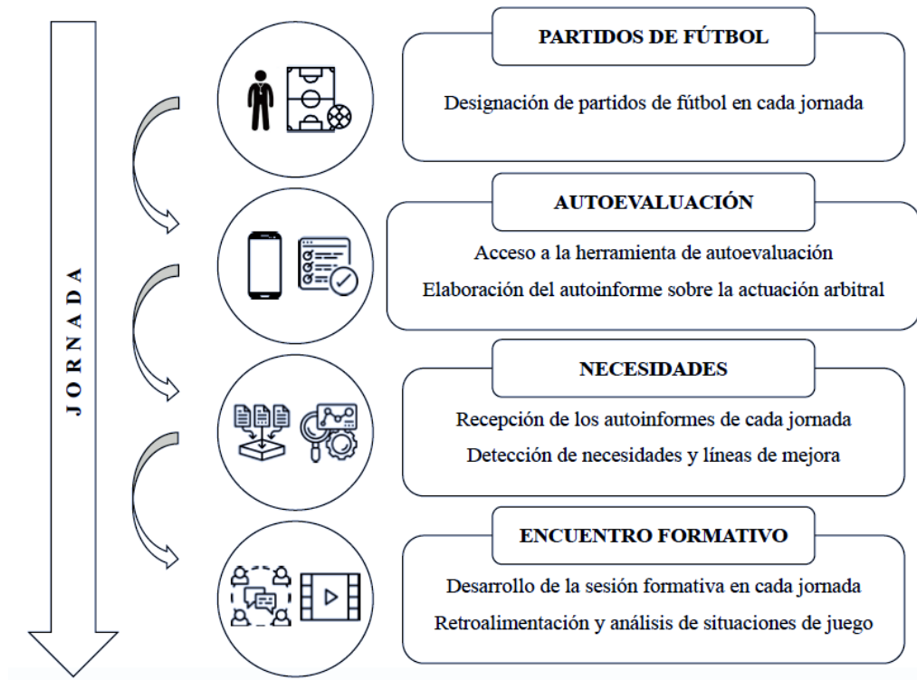
Figura 1. Enfoque pedagógico de la experiencia formativa

Durante las jornadas del torneo, se disputaron una gran cantidad de partidos de fútbol. Contó con categorías masculinas y femeninas, en modalidad de fútbol 11 y fútbol 8. Las edades de los jugadores se encontraban entre los 10 y los 18 años. El formato de la competición constó de una primera fase de grupos y por una fase final de eliminatorias. Los partidos de fútbol se disputaron en terrenos de juego situados en San Sebastián y en localidades próximas. En esta edición, el grupo de árbitros dirigió un total de 371 partidos. Este número corresponde con la totalidad de los informes de autoevaluación que realizaron los participantes en cada una de las jornadas del torneo (Tabla 3).