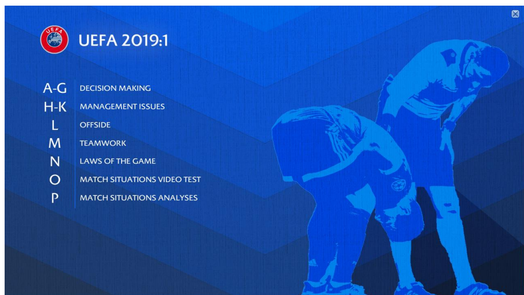
Figura 3. Índice de contenidos del Refereeing Assistance Programme (RAP) 2019

Dependiendo de las áreas de mejora observadas en las valoraciones, se establecieron las temáticas para desarrollar en cada sesión, usando el vídeo como principal recurso didáctico. Se utilizó el material audiovisual Refereeing Assistance Programme (RAP) 2019, elaborado por la Union of European Football Associations (UEFA) (UEFA, 2019). Este recurso ofrece un amplio repositorio de vídeos sobre situaciones de juego de distintas competiciones, clasificados en distintas temáticas (Figura 3).