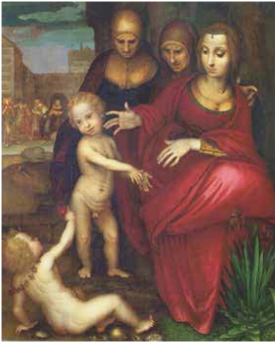
Fig. 1.- Fernando Yáñez de Almedina, Santa Generación , hacia 1524. Madrid, Museo del Prado, inv. P002805.

en el catálogo a él atribuido, que sin embargo enriquece la geografía artística antes mencionada con etapas adicionales. De hecho, aparte de las pruebas musealizadas (como las tablas del Prado, incluido el ejercicio luminístico y prospectivo de la Santa Catalina , de procedencia incierta), los testigos que aún se encuentran in situ se reflejan con facilidad en este cronograma, sugiriendo algunas incursiones provinciales, en relación directa con las ciudades metropolitanas habitadas por Yáñez: es el caso, por ejemplo, del retablo