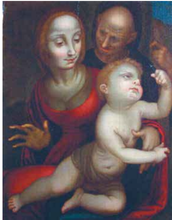
Fig. 3.- Copia de Fernando Yáñez de Almedina, Sagrada Familia , después de 1523. Colección particular.

[fig. 3] Ya en 1999, respaldado por la referencia cronológica a 1523, Ibáñez Martínez –de acuerdo con la propuesta de autografía expresada por el Post– había señalado cómo tal cronología imponía de considerar la obra un producto extremo de la estancia almediniense del pintor, antes de sus trabajos para Cuenca (que datan desde 1525). En su opinión, el aspecto oscuro de la escena se adapta bien al estilo tardío del Yáñez, inclinado a una consistencia más sustancial del claroscuro: por lo tanto, autoriza su colocación en una de las fases de articulación concluyentes de su parábola creativa. 20 Además, para el historiador, la misma composición confirma su pertinencia en vista de tal lectura. De hecho, si el grupo de la Virgen y el Niño testimonia de la duradera pasión del artista por Leonardo, el rostro del decrepito San José, no menos influenciado por el naturalismo analítico del maestro toscano, sería reutilizado para una de las figuras de contorno en la Adoración de los pastores , reali-