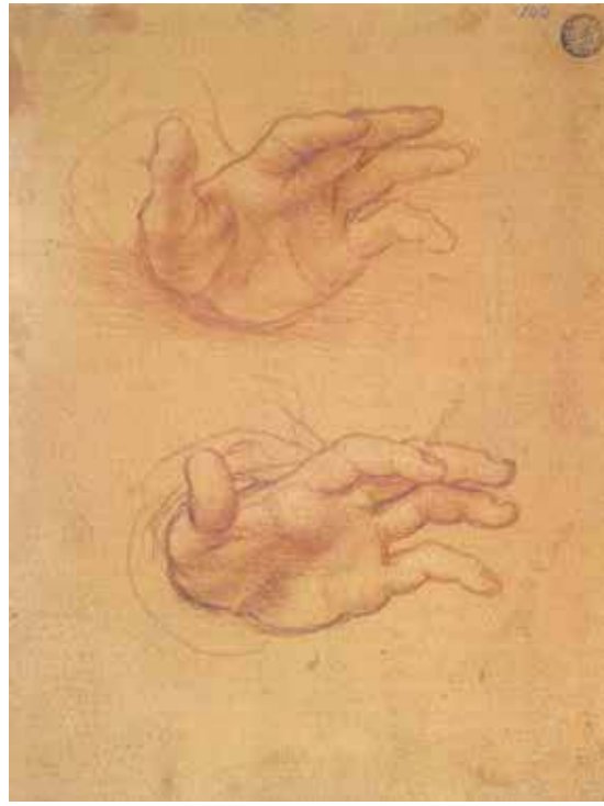
Fig. 7.- Fernando Yáñez de Almedina (attr.), Estudio de manos . Venecia, Gallerie dell'Accademia. Inv.

En relación con los afectos de los que se carga la figura de María, no es completamente indiferente, por ejemplo, la estilización exasperada a la que está sometida la mano derecha, abierta en una sorpresa mayor que el arpegio natural al que se adaptan los dedos en las dos obras antes mencionadas; y es digno de mención que una tensión similar se encuentra en uno de los dos estudios de manos, trazados en una hoja de las Gallerie dell'Accademia de Venecia, a menudo atribuida a Yáñez [fig. 8]. 27 Este énfasis sentimental se justifica por el mayor desequilibrio de