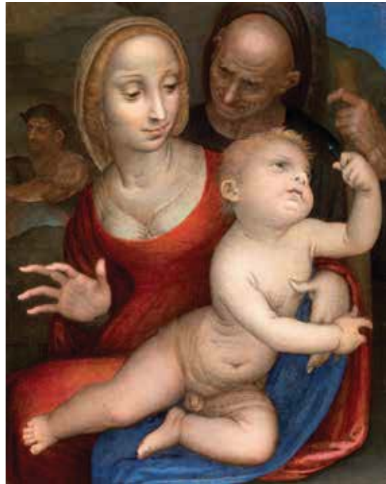
Fig. 5.- Fernando Yáñez de Almedina, Sagrada Familia , 1523. Colección particular.

[fig. 5] Esta sugerencia, la única que puede justificar el dictado de la inscripción, está confirmada por el descubrimiento de una otra tabla de dimensiones muy cercanas a la que ya se encontraba en la colección Grether, 23 cuya composición responde a la de la pintura publicada por Post, excepto por la presencia, detrás de la Sagrada Familia, de un par de personajes masculinos, atrapados en un juego de poses convergentes. La obra en cuestión, generalmente en buen estado (a excepción de algunos pasajes en la parte inferior de la tabla, como la mano derecha del Niño Jesús o los pliegues que caen del brazo izquierdo de la Virgen), encaja en una deslumbrante gama cromática, compuesta de rojos