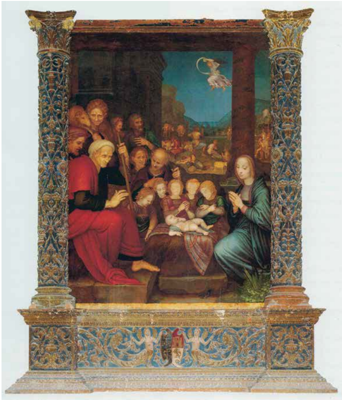
Fig. 4.- Fernando Yáñez de Almedina, Adoración de los Pastores , después de 1525. Cuenca, catedral de Santa María y San Julián.