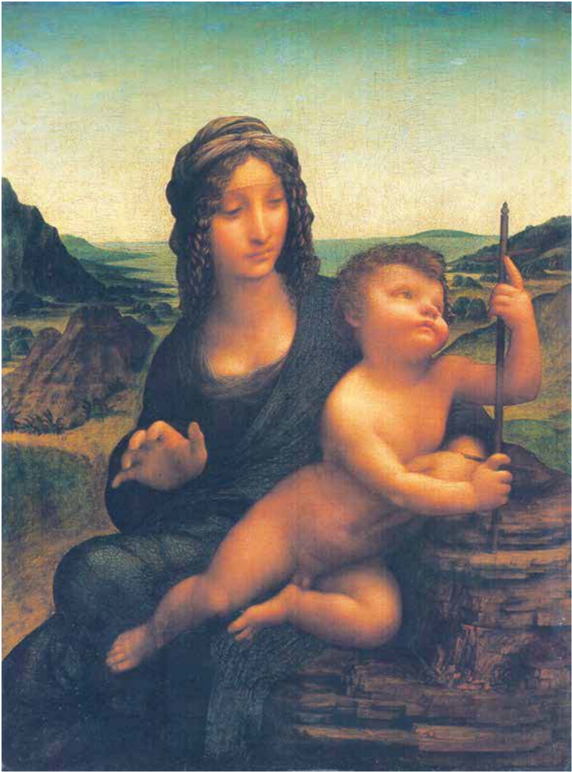
Fig. 8.- Leonardo da Vinci y taller (¿), Madonna con el Niño (Madonna Lansdowne) . Colección particular.