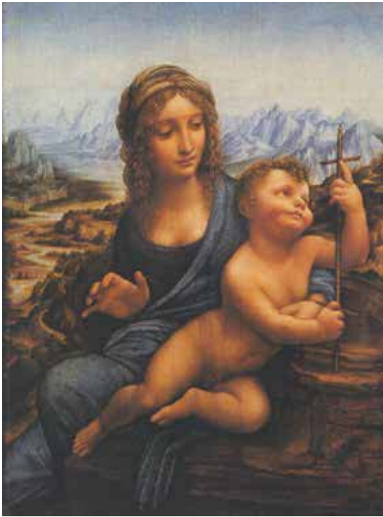
Fig. 6.- Leonardo da Vinci y taller (?), Madonna con el Niño ( Madonna Buccleuch ). Edimburgo, National Galleries of Scotland (Buccleuch Living Heritage Trust).