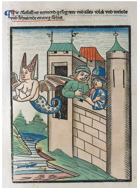
Fig. 5 – Melusina, 1476, Thüring von Ringoltingen, Melusine . Basileia: Bernhard Richel, 1476, fol. 62v 75 .