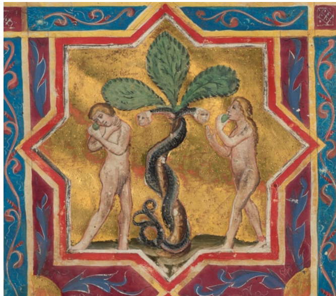
Fig. 8 – A serpente de duas cabeças, 1325-1340, Bible historiée , fol. 8v. 96

Poder-se-ia contra-argumentar com algumas imagens nas quais a serpente prosopogino está voltada para Adão 94 , ou para ambos 95 . Ou assinalar uma Bíblia francesa iluminada em Nápoles por um discípulo de Giotto, em 1325-1340, por encomenda do rei Roberto, o sábio, na qual a serpente é representada com duas cabeças humanas, uma virada para Eva, outra para Adão (fig. 8). Mas a intenção dessas imagens não era igualitária, pelo contrário, era advertir o homem dos perigos representados pela mulher, que é a serpente. Tratava-se de postura conservadora que sem chegar a colocar a responsabilidade pelo Pecado original exclusivamente sobre os ombros de Eva, insistia que a maior parte da culpa lhe cabia a ela.