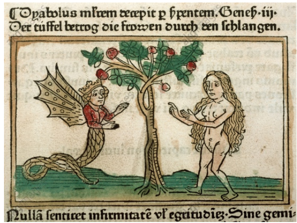
Fig. 6 – Lilith, c. 1473, Speculum humanae salvationis . Augsburg: Günther Zainer, fol. 11 76 .

Por intermédio da personagem mais antiga, a outra articulava-se igualmente com Eva. O banho que Melusina tomava aos sábados já foi associado à tradição judaica do banho purificador 77 e pode ser aproximado ainda ao banho penitencial de Eva começado no oitavo dia do Exílio, isto é, num sábado se considerarmos que ela e Adão foram expulsos do Éden numa sexta-feira 78 . Melusina deu a seu marido dez filhos, da mesma forma que