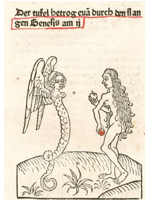
Fig. 3 – Eva e a serpente de Drach c.1480, Der Spiegel menschlicher Behältnis . Spira: s.ed. [Peter Drach], fol. 8 col. 1 25 .

O eixo da cena do Pecado original é a Árvore do fruto proibido, que divide a gravura em duas zonas opostas, porém complementares. À esquerda encontra-se o triângulo analógico serpente-Eva-macaco, à direita o Adão-cervo-unicórnio. Este é o triângulo claramente cristológico, como indica o significado de cada um dos personagens e, reforçando-os, da associação analógica entre eles – a quarta de nossa análise. Da mesma maneira que no primeiro triângulo o vértice é constituído pela serpente, no outro o vértice é Adão, personagem de caráter especular como Eva, contudo de sentido positivo: enquanto criatura ele é imagem de Cristo, que por sua vez enquanto encarnado é imagem do primeiro homem. Entende-se, então, que o artista tenha colocado à direita de Adão o cervo, de função salvadora inegável para a cultura medieval 26 . Daí por que o primeiro