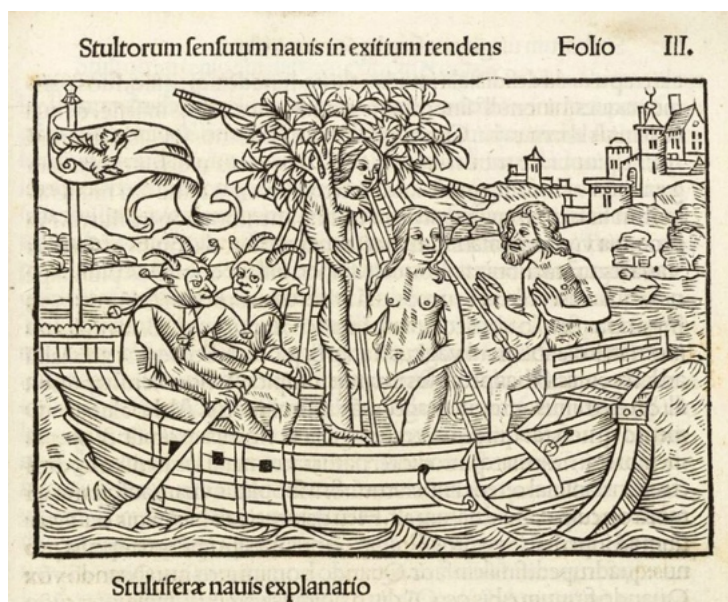
Fig. 4 – O Pecado original na nau dos loucos, 1500, Stultiferae naves sensus animosque trahentes mortis in exitium . Paris: Thielman Kerver, fol. III 40 .

conterrâneos, inclusive uma que apresenta claras afinidades formais com aquela que Vêrard faria alguns anos depois (fig. 4). Ademais, a referida tradução latina foi realizada pelo flamengo Josse Bade, que após ter vivido e trabalhado em Lyon de 1492 a 1498, mudou-se para Paris onde paralelamente à atividade de erudito exerceu também as de editor e impressor.