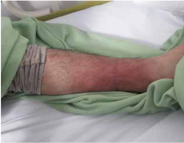
FIGURA 1. Placa eritematosa de bordes irregulares, dolorosa, asociada a calor local, en tercio distal del miembro inferior izquierdo.