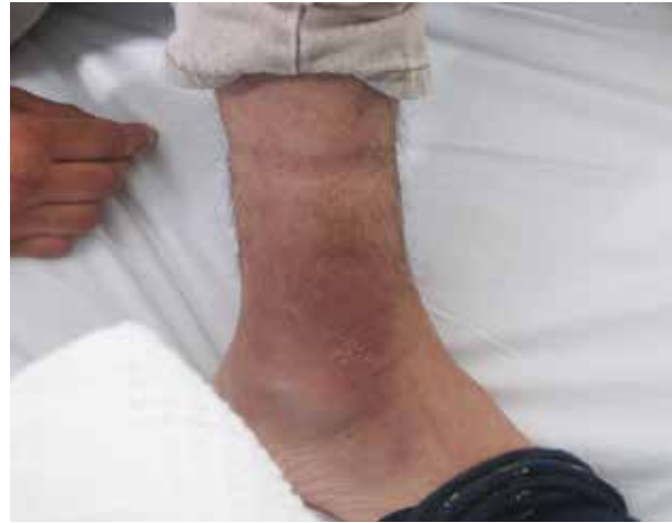
FIGURA 2. Placa eritematosa de bordes irregulares con desca-mación periférica en el cuello del pie derecho.