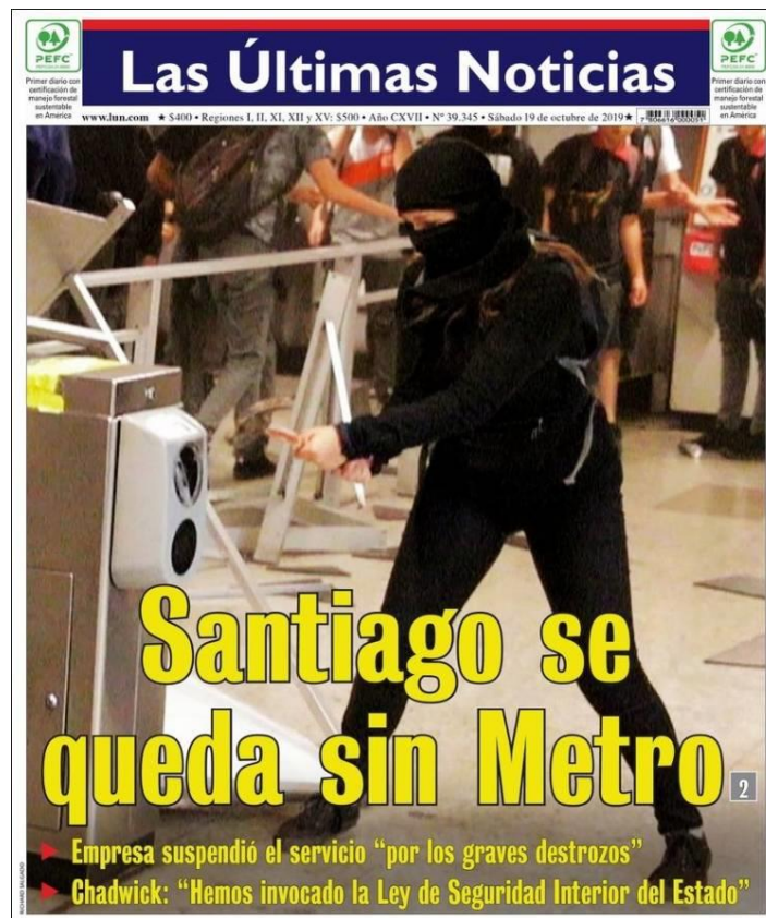
Figura 12. Portada y Titular del día 19 octubre.

Y en la misma línea tenemos que: (...) “la construcción de imaginarios sociales y de identidades tiene una dimensión política y es fruto de conflictos sociales y culturales entre los sectores implicados” (COMAS D’ ARGEMIR, 2008, p. 204). A continuación, algunos ejemplos a mencionar para analizar el rol que cumplieron los medios: