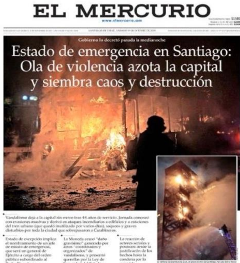
Figura 13. Portada de El Mercurio de Santiago, 19 de octubre.

texto que le sigue reafirma el contenido de destrucción proyectado por la imagen agregando además el adjetivo de gravedad. El último mensaje podría ser interpretado como una señal de disciplinamiento, pues alude a una ley que endurece las penas de los delitos en relación a la ley ordinaria. Estas acciones comunicativas usualmente buscan generar la condena social de los hechos referidos y tienden a provocar miedo sobre todo en las personas mayores. Finalmente cabe decir que, la portada y el titular es el espacio donde la jerarquización y priorización de la información alcanza su nivel más alto.