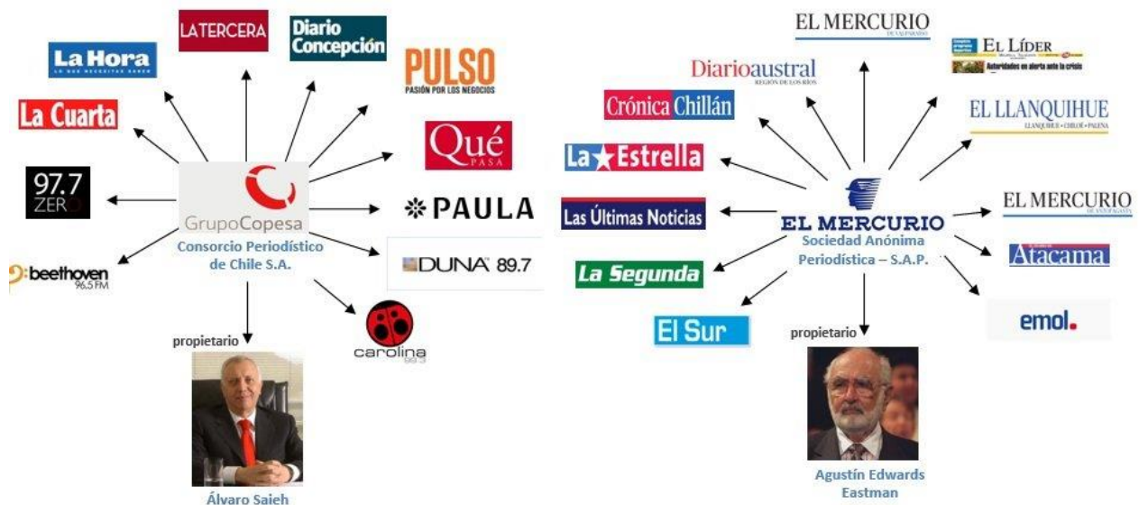
Figura 9. El duopolio de la prensa escrita en Chile

Fuente: Periódico digital El Ciudadano 81