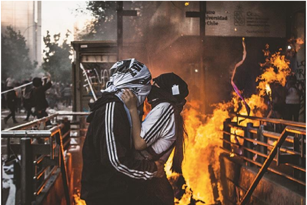
Figura 4. Dos manifestantes hacen una pausa en medio de las protestas.

Como apunta Sergio Grez (2019), un estallido social es un evento explosivo y breve que rápidamente en horas o días se apaga. No es este el caso analizado, donde las protestas y manifestaciones continúan en noviembre con gran intensidad y masividad, tornándose constantes. Las protestas ya no son, entonces, interrupción de la normalidad porque ahora la normalidad es la protesta diaria. Una rebelión atraviesa por distintas fases, y el mes de noviembre se puede caracterizar como la fase de consolidación donde los hitos que destacan son: el intento de una salida institucional al conflicto por parte de la “clase” política, la continua violación a los DD.HH que da lugar a la elaboración de diferentes informes internacionales, y la irrupción feminista que trae nuevas fuerzas vivas a la lucha y que surge inicialmente como respuesta a la violencia estatal.