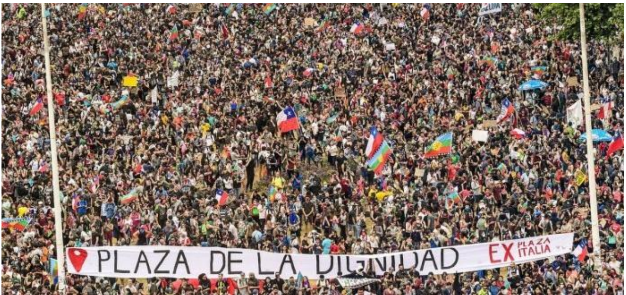
Figura7. Manifestantes congregados en Plaza de la Dignidad, ex Plaza Italia.