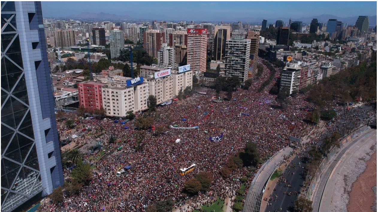
Figura 9. Multitudinaria marcha feminista 8 de marzo.

Las jornadas de marzo estuvieron marcadas también por el día de la mujer. En gran número las mujeres colmaron las calles en todo el país. La organización feminista, Coordinadora 8M, cifró en 2 millones las manifestantes sólo en la capital, aunque Carabineros indicó 150 mil 56 .