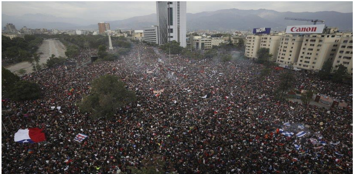
Figura 3. “Chile despertó”. Masiva protesta a una semana del inicio del conflicto.

El viernes 25 de octubre se llevó a cabo la que es considerada como la marcha más grande en la historia de Chile, donde se estima que salieron a las calles alrededor de 3 millones de personas a lo largo y ancho del país. La intendenta de la Región Metropolitana, Karla Rubilar, cifró la cantidad de asistentes en el centro de Santiago en 1 millón 200 mil personas 29 .