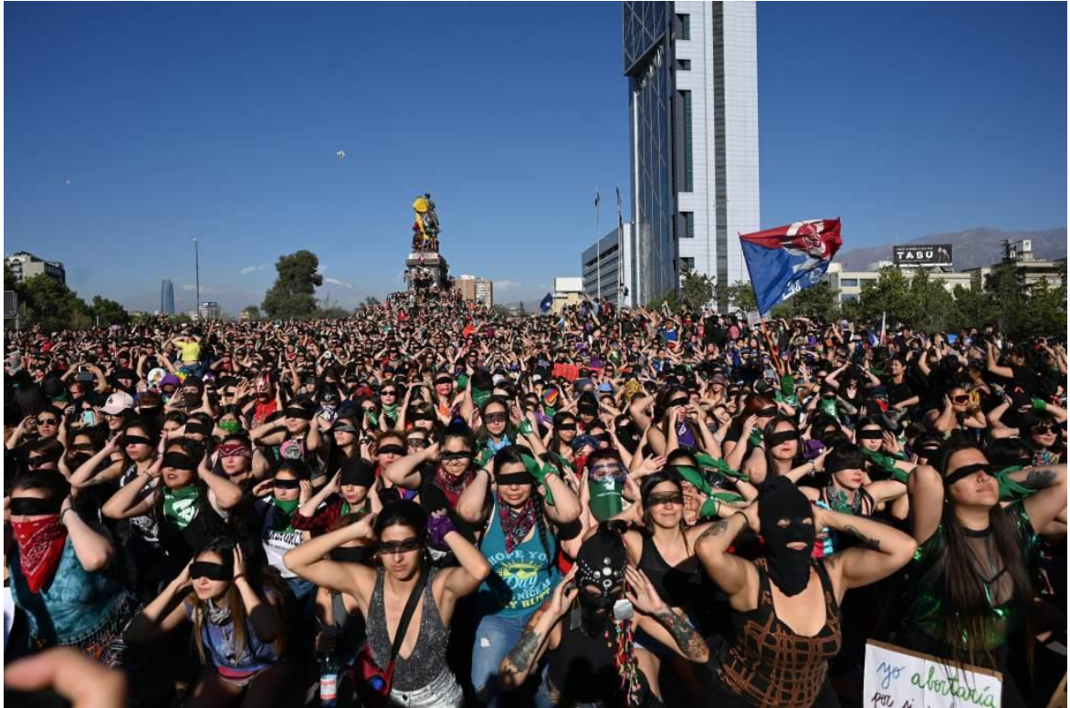
Figura 6. Mujeres realizando performance un violador en tu camino , en Plaza Dignidad.