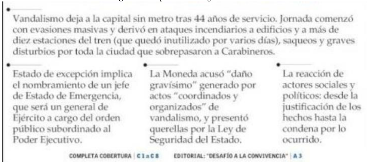
Figura 14. Ampliación de imagen anterior

en llamas complementa el panorama desolador. La imagen en recuadro inferior que corresponde al edificio corporativo de ENEL (el mayor holding eléctrico del país), ubicado en pleno centro de Santiago y que aparece incendiándose, completa la escena. El Mercurio -perteneciente al grupo Edwards-, es de tipo tradicional y conservador; y apunta a un segmento serio y recatado.