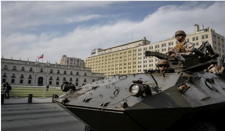
Figura 2. Militares frente a La Moneda ocupando las calles de Santiago

Luego que se decretara el estado de emergencia para algunas zonas de Santiago, este se amplió para toda la región metropolitana 24 y para la región de Valparaíso y la comuna de Concepción. Además, se estableció el toque de queda para toda la región metropolitana, prohibiéndose la circulación en la vía pública entre las 22:00 y las 07: 00 horas. Esta medida no se tomaba desde enero de 1987, época que aun imperaba la dictadura patronal-militar y, por tanto, evoca en el imaginario de una parte de la sociedad chilena los peores recuerdos del terror pinochetista.