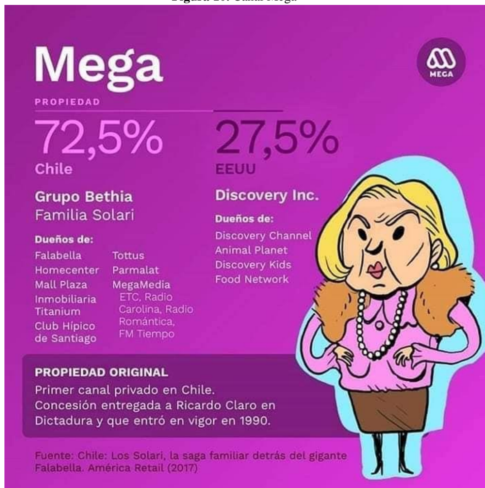
Figura 10. Canal Mega

Por otro lado, respecto a los medios de televisión de señal abierta, cinco son los principales canales: TVN, (canal estatal), MEGA, CHV, Canal13, y La Red (canales privados). Mega fue el primer canal de televisión privado del país. Su primer dueño fue Ricardo Claro Valdés, empresario y agente de la DINA 82 . En 2012, el canal fue adquirido por el grupo