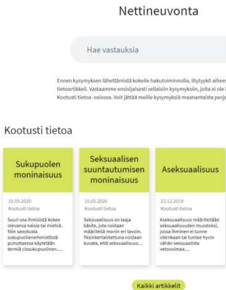
Kuva 2. Kuvakaappaus nettineuvonnan kootusti tietoaosiosta

luottamuksellisesti. Koska Sexpo-säätiön nettineuvontaa hallinnoivat asiantuntijat, sinne lähetetyt kysymykset ovat tarkasti kohdennettuja jo julkaistaessa. Asiantuntijat ovat myös poistaneet kysymyksestä mahdollisia tunnistetietoja anonymiteetin suojaamiseksi. Sexpo-säätiön nettineuvontaan kirjoittajat saavat apua seksuaalisuuden, seksin, sukupuolisuuden ja ihmissuhteiden kysymyksiin kirjoittaessaan Sexpo-säätiön nettineuvontaan (Sexpo, 2019b).