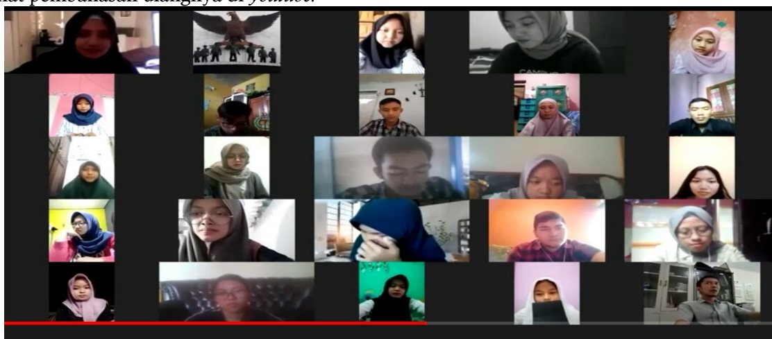
Gambar 3 Pembahasan Materi di Zoom

Ketiga, membahas materi di zoom (Gambar 3) setelah mahasiswa menyimak dan memberikan pertanyaan di materi youtube . Pembahasan di zoom juga direkam untuk diupload lagi di channel youtube . Cara ini cukup membantu mahasiswa yang belum paham penjelasan langsung di zoom dapat melihat pembahasan ulangnya di youtube .