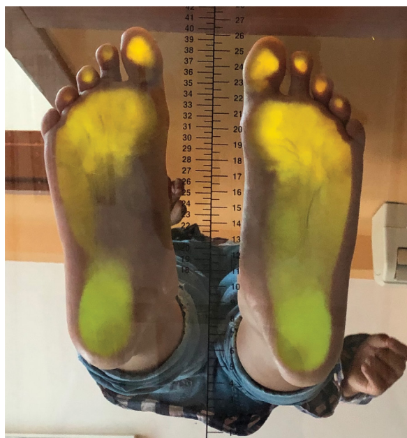
Ryc. 1. Badanie stopy z użyciem podoskopu. Stopa lewa płasko-koślawą