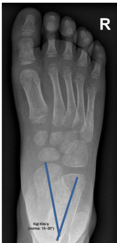
Ryc. 4. Pomiar kąta Kite'a stopy (RTG w projekcji przednio-tylnej)

opiera się na osteotomiach: tylostopia i śródstopia, artroerezie i artrodezie. Szeroki zakres zabiegów daje różny zakres skuteczności i wyników długoterminowych.