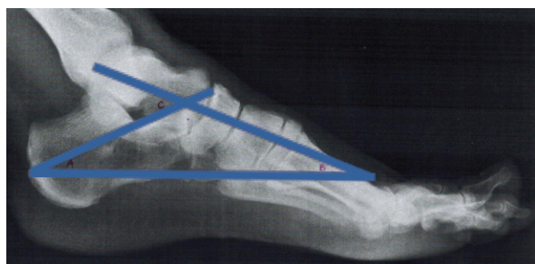
A – kąt nachylenia kości piętowej ( calcaneal inclination angle , CIA); B – kąt nachylenia kości skokowej ( talar declination angle , TDA); C – kąt Kite'a boczny (kąt boczny skokowo-piętowy) ( lateral talocalcaneal angle , LTA).

Leczenie farmakologiczne w przypadku bólu pojawiającego się przede wszystkim okolicy stępu polega na zastosowaniu leków przeciwbólowych i przeciwzapalnych. Leczenie stopy płasko-koślawej korygującej rozpoczyna się od obserwacji i okresowych kontroli. Występowanie stopy płasko-koślawej po 3. roku życia wymaga wdrożenia leczenia. Przy niewielkich deformacjach pacjenci wymagają rehabilitacji, polegającej na ćwiczeniach mięśni krótkich stopy, stretchingu ścięgna Achillesa oraz rehabilitacji proprioceptywnej. Należy także rozważyć rozpoczęcie stosowania wkładek supinujących, standardowych lub wykonywanych na miarę, które mają za