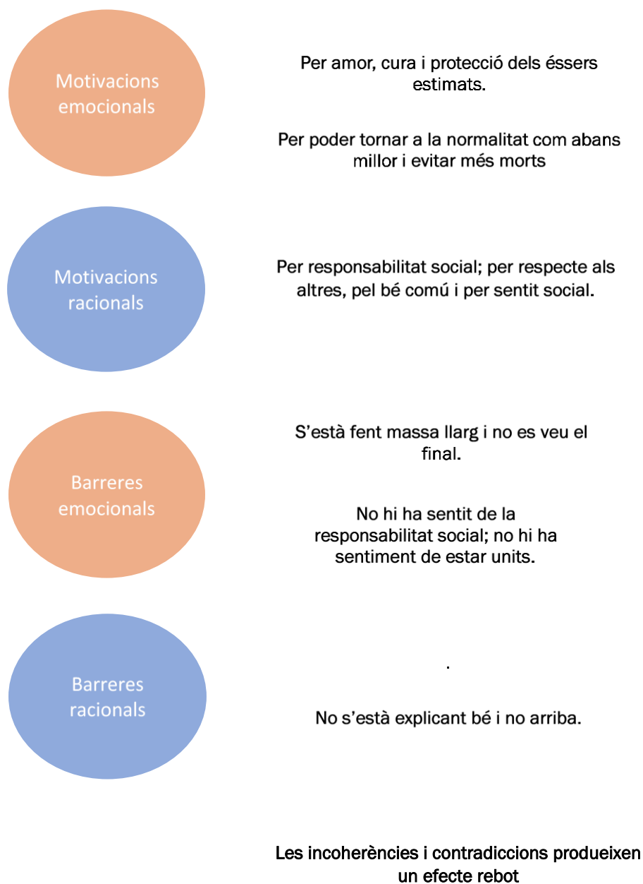
Figura 2: Motivacions emocionals i racionals dels i les joves