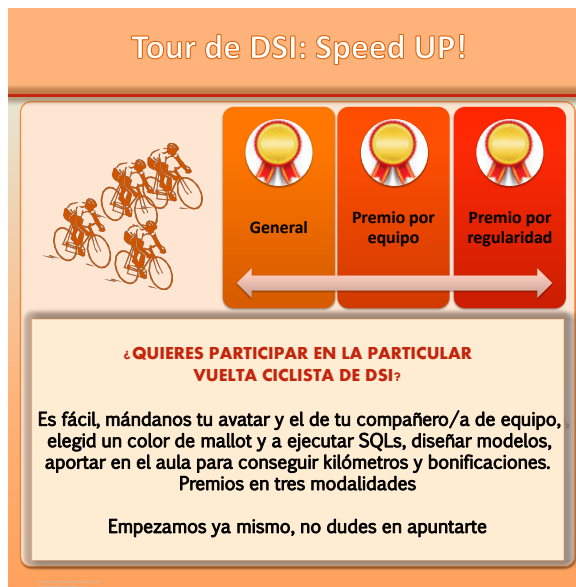
Figura 2: Cartel de participación.

En este apartado se describirá la experiencia tanto desde el punto de vista de los profesores como de los alumnos, esta última recogida con una breve encuesta anónima al finalizar el curso.