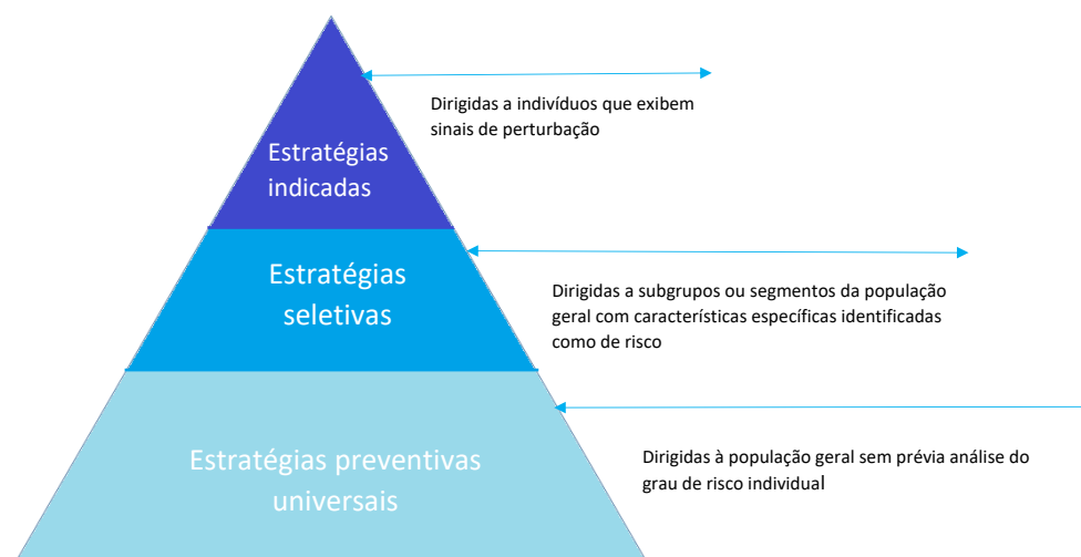
Figura 3. Definição de estratégias universais, seletivas e indicadas.

É baseado nos princípios elencados ao longo deste documento que o ProChild CoLAB tem vindo a desenvolver, em articulação com o Município de Guimarães, projetos de intervenção comunitária que têm por objetivo promover o bem-estar e a resiliência das crianças durante e após o período de pandemia COVID-19. Para tal, tem contado com a mobilização da rede social de emergência do município e da sua articulação com os profissionais dos setores da educação, saúde e proteção das crianças. As intervenções implementadas visam o reforço e a reorganização dos recursos existentes no sentido de uma intervenção comunitária multinível que se baseia em estratégias universais, seletivas e indicadas que serão adequadas às necessidades evidenciadas pelas crianças e famílias, tal como indicado na Figura 3. Serão apresentadas em seguida, cada uma destas estratégias.