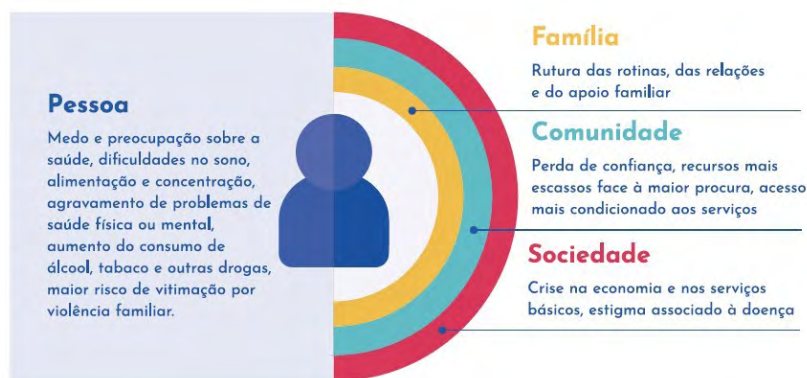
Figura 1. Impacto socioecológico da pandemia COVID-19 (adaptado a partir do esquema da Alliance for Child Protection in Humanitarian Action, 2019, p. 2).

Destacam-se os efeitos das medidas de confinamento na saúde física (e.g., desregulação de padrões de sono, exercício físico e alimentação) e mental das crianças que, associados à sua duração prolongada, ao medo da doença, à informação inadequada ou alarmista, ao espaço limitado, à disfunção e stressores familiares (Liu, Bao, Huang, Shi, & lu, 2020; Wang, Zhang, Zhao, & Zhang, 2020), aumentam a incidência de perturbações associadas ao stress e trauma (Sprang & Silman, 2013). O afastamento do meio escolar contribuiu para o surgimento de sentimentos de solidão, tristeza e frustração por parte das crianças, que se viram privadas de interações presenciais com os pares e com os/as professores/as e de momentos lúdicos nos recreios, centrais para o seu desenvolvimento e bem-estar. Os resultados preliminares de um estudo transnacional coordenado pela Faculdade de Psicologia da Universidade de Lisboa e ProChild CoLAB corroboram este impacto ao nível de indicadores clínicos de ansiedade nas crianças portuguesas em período de pandemia, apontando para 11.3% numa amostra de 565 crianças entre os 6 e os 16 anos.