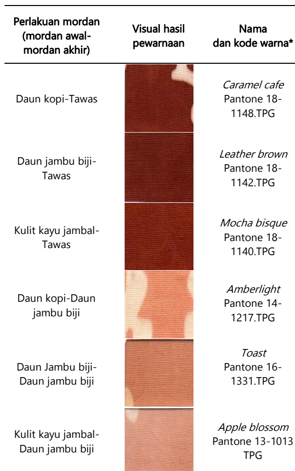
Tabel 2. Analisa visual warna berdasar Pantone Color Guide