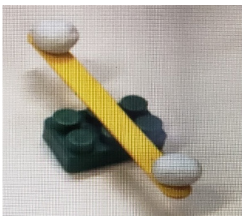
Fig. 1. Gangorra.