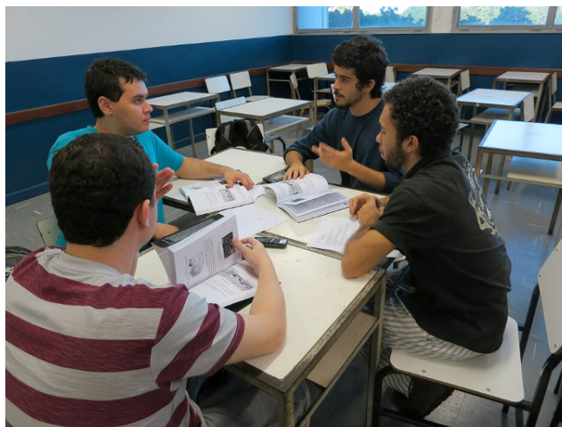
Fig. 4. Oficina com alunos trabalhando as questões da Física em Quadrinhos.

Em relação ao projeto Física em Quadrinhos, desenvolvido por Souza desde 2012, são desenvolvidas várias tirinhas para o ensino de óptica em que são apresentadas situações do cotidiano para que os estudantes do Ensino Médio, ou licenciandos e até mesmo professores em serviço, que participam ou participaram das diversas oficinas ministradas pelo autor, são instigados a discutir em grupos, preferencialmente heterogêneos, como mostrado na figura 4, cada tirinha com questões abertas elaboradas por Souza, exemplificada na figura 5.