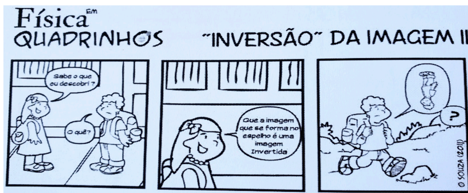
Fig. 5. Tirinha sobre imagens.