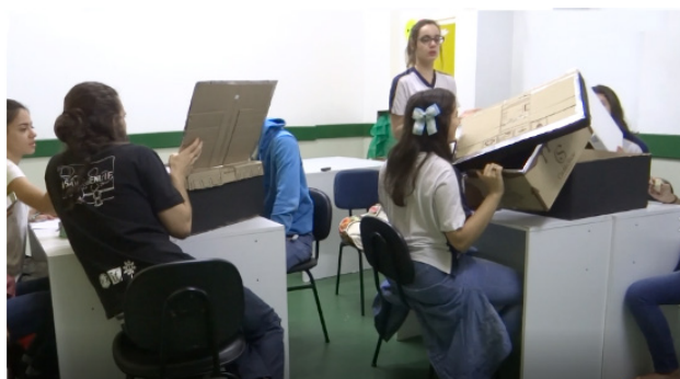
Fig. 6. Foto forno solar com alunos investigando o cozimento.

[...] em um significado maior para o aluno aprender esse conteúdo e evitando os "pulos" que geralmente são dados nos livros didáticos e nas aulas tradicionais, onde as equações e as explicações desse tópico aparecem em um parágrafo curto e direto (CORREIA e VIANNA, 2019, p.6).