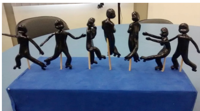
Fig. 3. Tridimensional do salto Axel.

maioria das escolas, ainda se apresenta com uma ênfase exclusivista. É raro encontrar alunos com deficiência visual em uma classe de Física junto com alunos normovisuais. Então, com o intuito de tornar o ensino desta ciência inclusivo e lúdico para todos os alunos, este trabalho propôs mostrar uma pesquisa em que o salto Axel, considerado o mais importante para os atletas da patinação artística, sendo elemento obrigatório nos programas de duração curta. Foi construído um material bi (figura 2) e outro tridimensional (figura 3), representando um atleta executando o referido salto, o que permitiu uma aproximação dos alunos durante as aulas de Física. O objetivo foi, através deste material didático, instigar os alunos da turma, fossem eles deficientes visuais ou normovisuais, para elaborarem, através da visão, quando possível, e do tato, os conceitos de movimento parabólico e do centro de massa do atleta, chegando a tornar a aula de Física efetivamente inclusiva com uma abordagem lúdica, a partir da patinação artística.