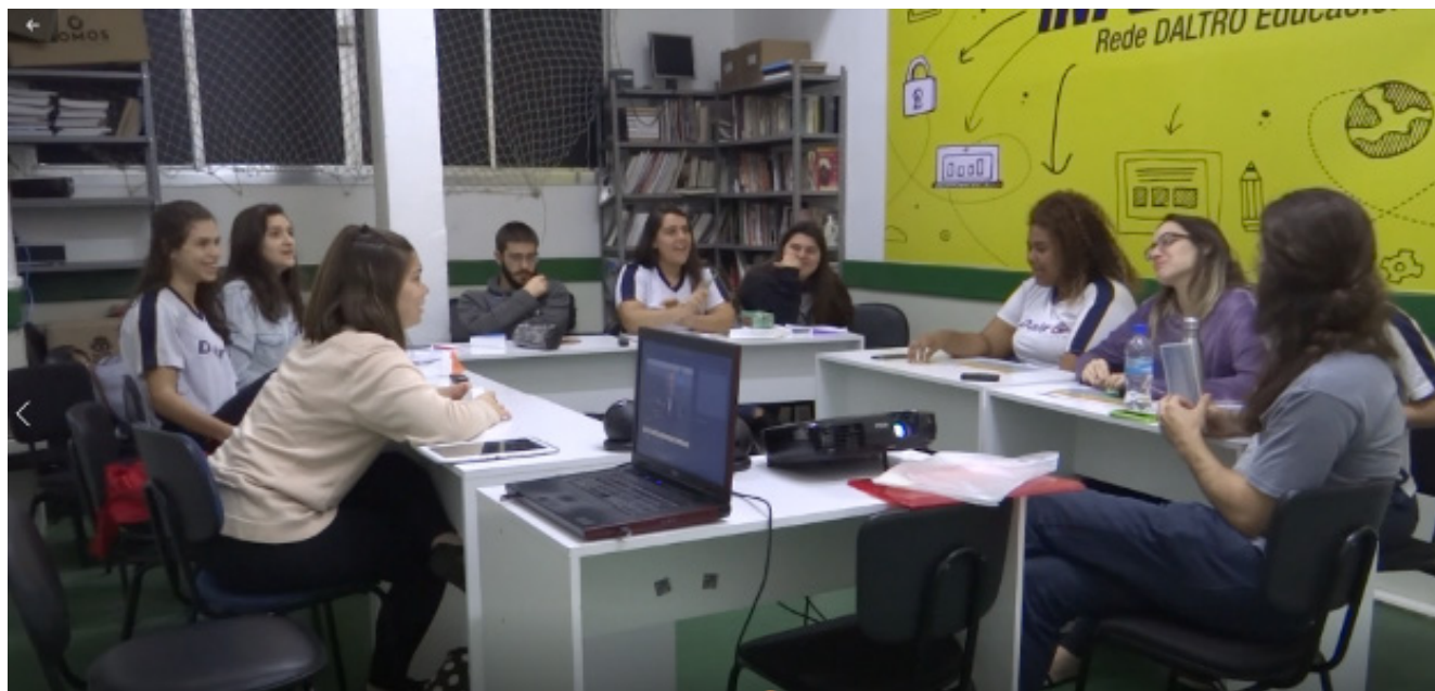
Fig. 7. Alunos debatendo o o problema energético.

Estas propostas educacionais, realizadas por diversos professores da educação básica em diferentes realidades educacionais e aqui citadas, mostram que o ensino tradicional pode ser modificado para um ensino mais ativo. Nosso intuito foi de demonstrar que as atividades através do método investigativo são trabalhosas e exigem pleno conhecimento e domínio