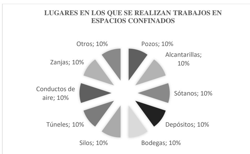
Ilustración 5. Lugares en los que se realizan trabajos en espacios confinados

La ilustración 4 Actividades en las que se realiza trabajo en espacios confinados, indica que el mayor porcentaje con el 25% lo ejecuta la actividad de construcción como tal, seguido de la actividad de reparaciones con el 20%, posteriormente las actividades de: mantenimiento, inspecciones y rescates con el 15% y finalmente la actividad de limpieza con el 10%.