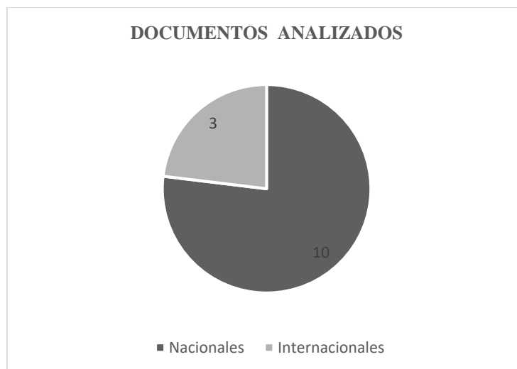
Ilustración 2. Documentos analizados

Una vez leídos los documentos, se analizaron diferentes aspectos como: número de documentos analizados nacionales e internacionales, fecha de los documentos, así como los peligros y riesgos identificados en la actividad de trabajo en espacios confinados en el sector de la construcción. Los resultados del análisis se plasman en las ilustraciones 2 al 6 a continuación: