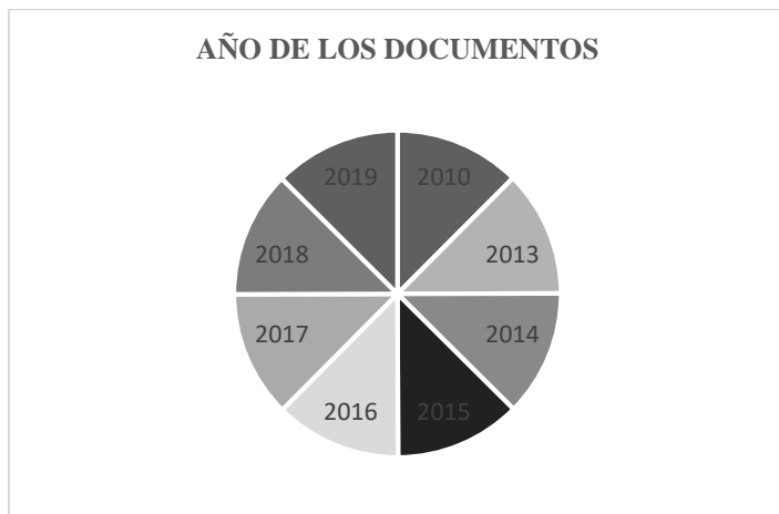
Ilustración 3. Año de los documentos

En la ilustración 2 Documentos analizados, se observa que se analizaron en total 13 documentos de los cuales 10 fueron de orden nacional y 3 de orden internacional, esto con el fin de tener información representativa de nuestro país.