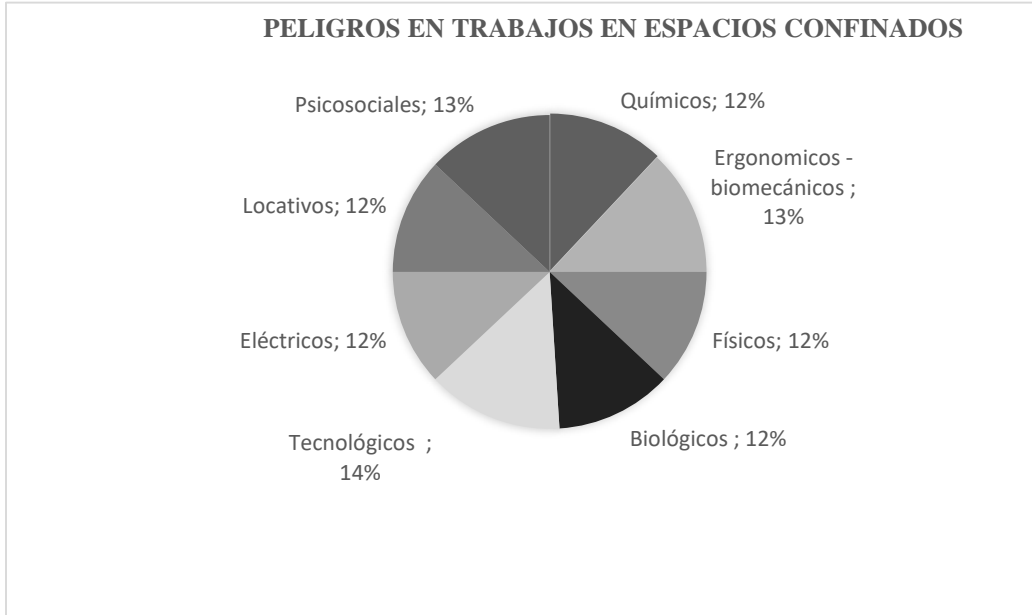
Ilustración 6. Peligros en trabajos en espacios confinados