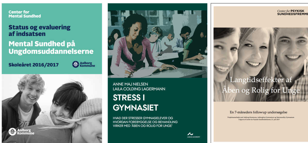
Fig. 1. Tre af de tidligere Åben og Rolig for Unge-rapporter. Se dem alle på www.cfps.dk .

Analyse af frafald og datatab: For at undersøge betydningen af frafald og datatab analyserede vi om gruppen af elever fra hvilke data for de primære effektmål (PSS og MDI) blev opnået før og efter kurset adskilte sig signifikant på baggrundsvariable (jf. køn, alder, effektmål ved screening, psykiatrisk diagnose og fysisk sygdom) fra gruppen af elever fra hvilke data ikke blev opnået efter kurset. Analysen var baseret på opnået screeningsdata for begge grupper og blev udført med independent samples t-tests for nominale baggrundsvariable og Pearson's chi-square tests for katagoriske variable.