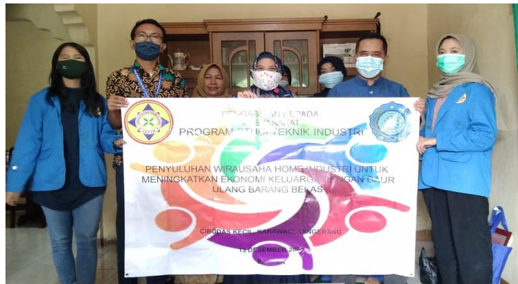
Gambar 5. Pelaksanaan PKM Keterampilan Wirausaha Home Industri