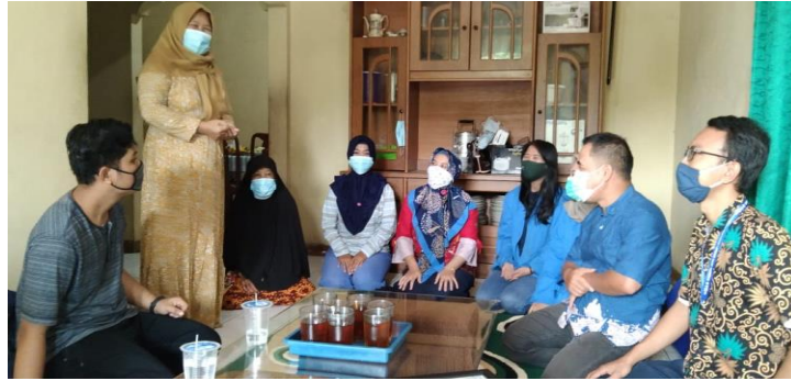
Gambar 3. Sambutan Ibu RT Tentang Wirausaha Home Industri