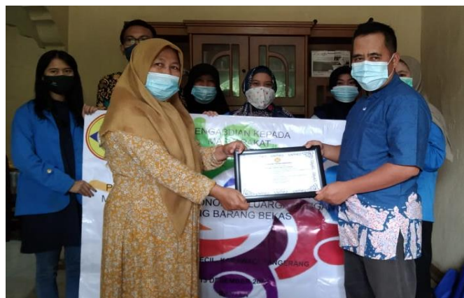
Gambar 6. Pemberian Piagam PKM Keterampilan Wirausaha Home Industri