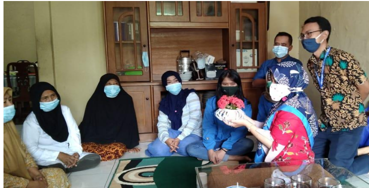
Gambar 4. Pemberian Materi dari Keterampilan Botol Bekas Menjadi Pot Bunga