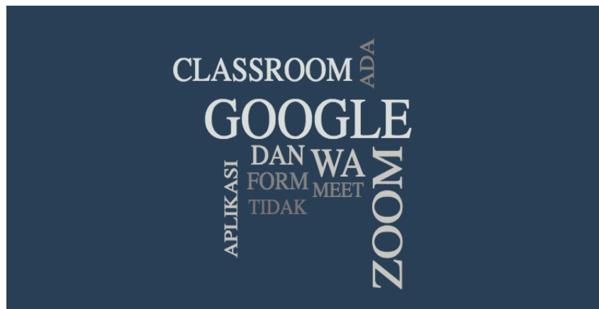
Gambar 4. Aplikasi Aplikasi yang digunakan untuk melaksanakan kegiatan pembelajaran online

Dari Tabel 2. Jelas bahwa sebagian besar aplikasi yang digunakan untuk melaksanakan kegiatan pembelajaran online adalah Google classroom, Zoom dan WhatsApp, dan sebagian kecil yang lainnya menggunakan aplikasi lainnya. Lebih jelas digambarkan pada Gambar 4.