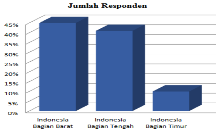
Gambar 1. Asal Responden

Penelitian ini dikuti oleh Kepala sekolah sebanyak 63 orang dari berbagai daerah yang tersebar di seluruh Indonesia. Yang disajikan pada gambar berikut.