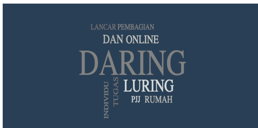
Gambar 3. Pelaksanaan kegiatan pembelajaran di sekolah setelah terjadinya pandemi Covid 19

Dari Tabel 1. Menunjukkan bahwa sebagian besar proses pelaksanaan kegiatan pembelajaran di sekolah setelah terjadinya pandemi Covid-19 dilakukan secara online dengan beberapa istilah yang dimunculkan yaitu, daring, online dan PJJ (Pembelajaran Jarak Jauh) dan beberapa respon menjawab bahwa proses pembelajaran dilakukan tatap muka dan beberapa menyampaikan bahwa proses pembelajaran lancar. Lebih jelas digambarkan pada gambar 3.