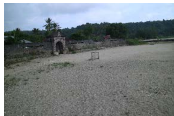
Gambar 5. Bagian dalam benteng yang kerap digunakan penduduk setempat sebagai lahan bermain sepak bola gawang mini

Hetaria. Beliau mengatakan bahwa pihak yang berwenang, seperti Balai Pelestarian Cagar Budaya/ BPCB Ternate, tetap memperhatikan tinggalan cagar budaya tersebut meskipun terkadang beberapa kebutuhan terkait untuk kebersihan benteng dan gaji juru pelihara terkesan lambat.