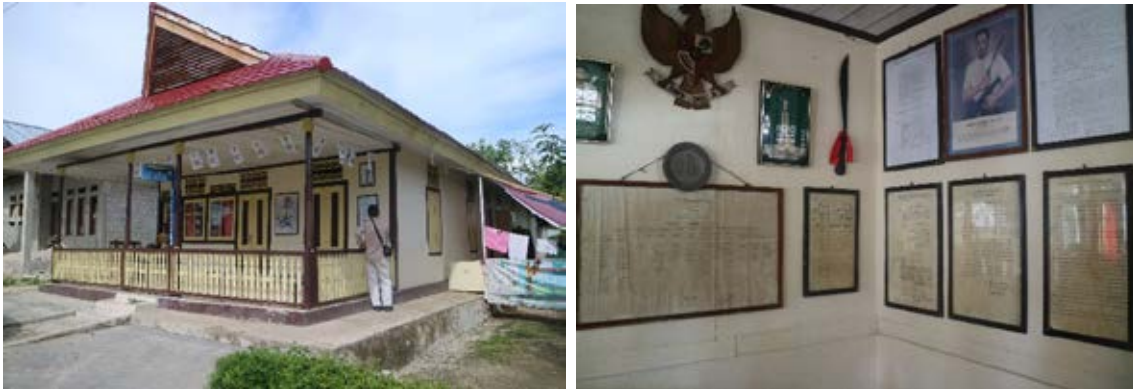
Gambar 10. (Kiri) tampak depan rumah Kapitan Pattimura (Kanan) Beberapa memorabilia dan ruang pameran di dalam rumah Kapitan Pattimura

Dengan melihat tinggalan yang masih tersisa, kita (generasi sekarang) akan terbawa ke scope temporal waktu yang lalu. Kisah itu masih hidup dalam material culture hingga masih bisa didengar dari kapata ujaran oral generasi terdahulu.