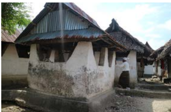
Gambar 3. Keramat di sekitar rumah penduduk dan di sekitar Masjid Rohomoni

menunjukkan arsitektur asli atau vernakuler. Kata vernacular sendiri berasal dari vernaculus (Latin) dan berarti asli ( native ). Arsitektur vernakuler dapat diartikan sebagai arsitektur asli yang dibangun oleh masyarakat setempat. Arsitektur vernakuler tumbuh dan berkembang dari lubuk tradisi komunitas masyarakat lokal (etnik), yang mengakomodasi nilai ekonomi dan tatanan sosial budaya masyarakat yang bersangkutan. Dibangun oleh tukang kepercayaan hanya berdasarkan pengalaman, teknologi sederhana, dan material lokal, serta merupakan jawaban atas setting tempat (lingkungan) bangunan tersebut berada. Oleh karenanya, acapkali dikatakan sebagai karya yang naif, bersahaja dan berasal dari spontanitas masyarakatnya. Hasilnya kemudian terbaca sebagai karya arsitektur yang memiliki ciri karakter khas yang terbungkus oleh tata nilai dan budaya masyarakatnya (Oliver 2006, Malik dan Bharoto 2010; dalam Handoko 2013 : 40).