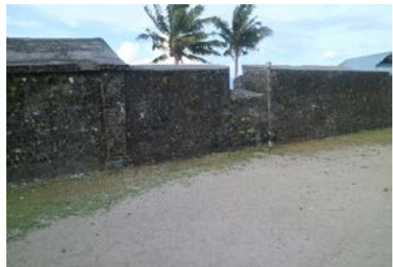
Gambar 7. (Atas) pintu gerbang benteng menghadap selatan (Bawah) Embrasure tempat meriam di bagian dalam benteng

tradisional). Biaya pembangunan benteng ditanggung oleh para residen tadi.