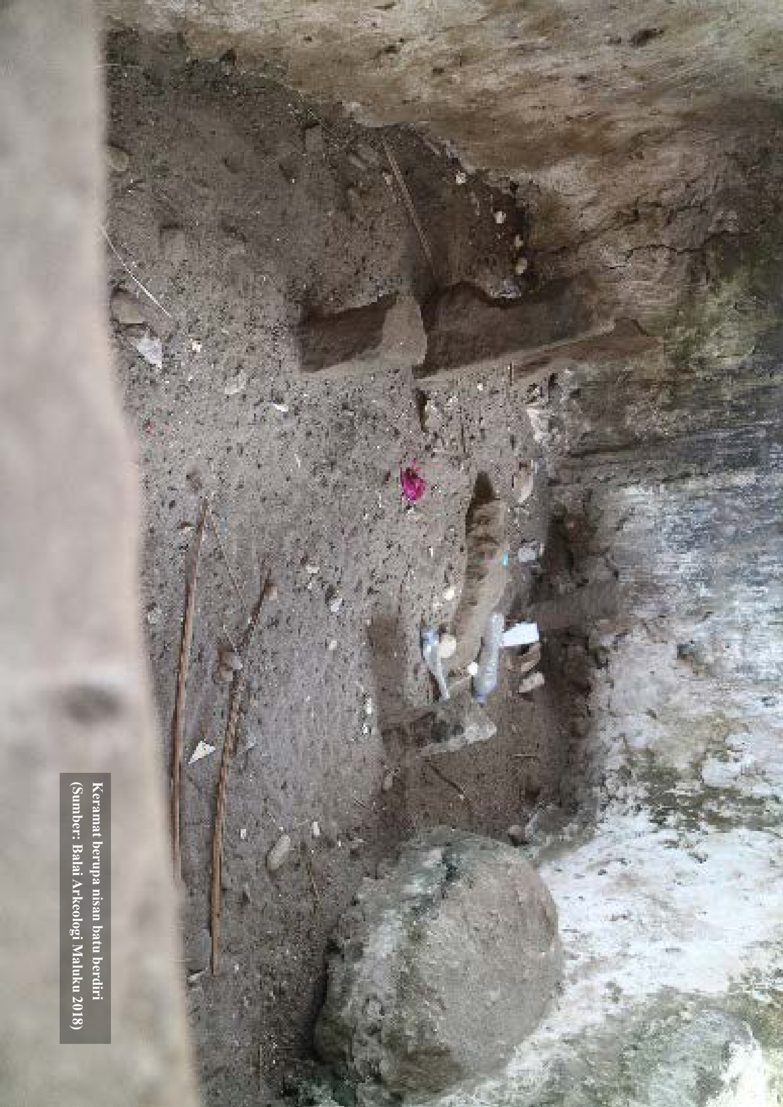
Keramat berupa nisan batu berdiri