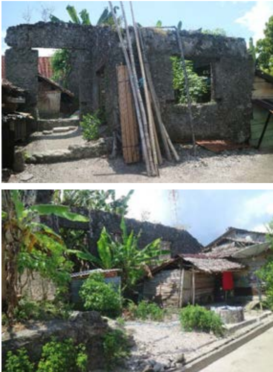
Gambar 9. (Atas) Sisa struktur tembok benteng (Bawah) Struktur tembok benteng yang berhimpit dengan rumah semi permanen penduduk