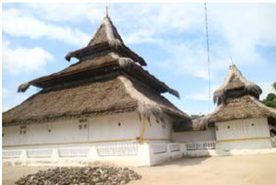
Gambar 2. Masjid Rohomoni dengan atap tumpang tiga

Karakteristik bentuk masjid yang diperlihatkan oleh Masjid Rohomoni tersebut merupakan representasi dari perkembangan arsitektur masjid dan perkembangan Islam di Nusantara. Mengutip (Handoko 2013) bahwa dalam beberapa aspek, arsitektur masjid