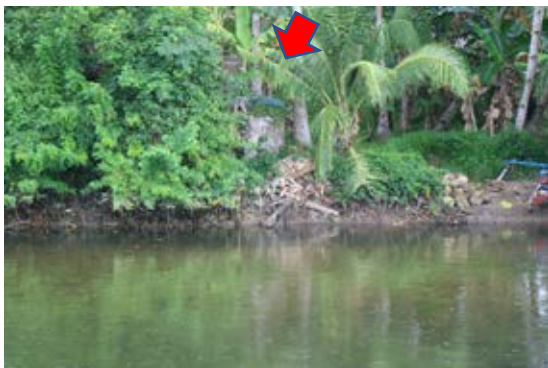
Gambar 6. Tanda panah menunjukkan bagian jembatan yang masih tersisa

Benteng Hoorn berlokasi di Desa Pelauw, Kecamatan Pulau Haruku, Kabupaten Maluku Tengah. Benteng ini dibangun pada tahun 1656 saat Arnold de Vlaming membangun satu rumah pertahanan yang berpagar kayu dan beratap nipah.