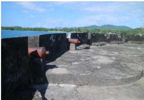
Gambar 8. (Kiris) Gapura benteng (Kanan) Embrasure tempat meriam di bagian dalam benteng yang langsung menghadap pantai Waisisil