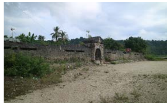
Gambar 4. (Atas) Gapura benteng (Bawah) Sisa tembok di bagian timur