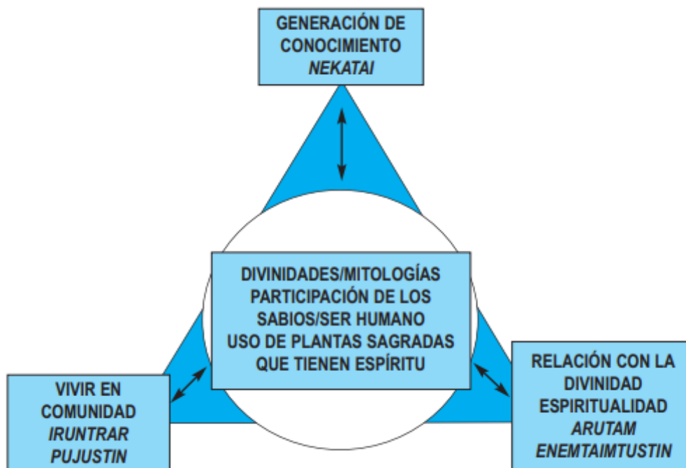
Graf. 1. Cosmovisão da integralidade e do equilíbrio