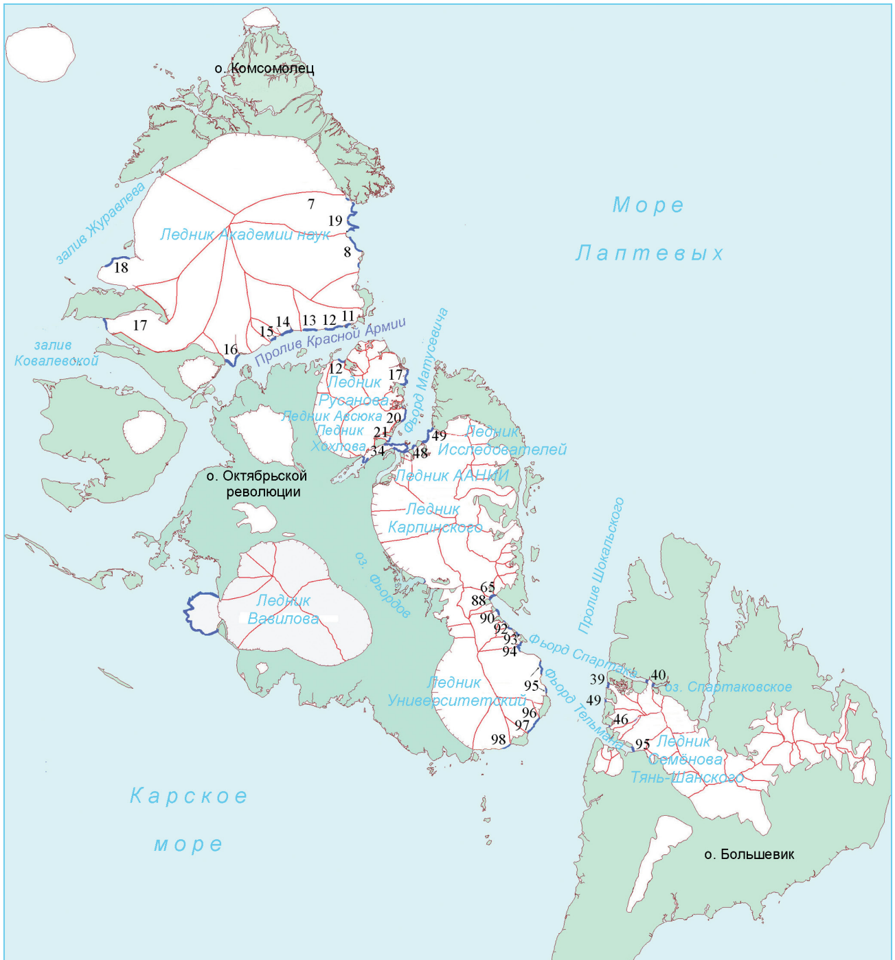
Рис. 1. Основные айсбергопродуцирующие ледники Северной Земли.

Номера выводных ледников даны по Всемирному каталогу ледников, а ледоразделы (показаны красными линиями) ледниковых куполов – в соответствии с базой данных GLIMS [11]