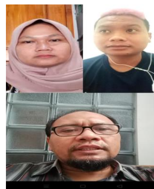
Gambar 1. Sosialisasi peran sosial BUMDes secara daring

Langkah awal yang dilakukan oleh tim pengabdian adalah melakukan sosialisasi terhadap pengurus BUMDes mengenai kapasitas peran sosial BUMDes dalam penanganan dampak ekonomi COVID-19. Sosialisasi ini merupakan hal yang penting agar pengelola BUMDes memiliki pengetahuan mengenai peran sosial mereka. Sosialisasi ini dilaksanakan secara daring kepada para pengurus BUMDes (Gambar 1). Tiga indikator penting yang dijadikan sebagai ukuran keberhasilan sosialisasi mengenai peran sosial yakni pengetahuan tentang peran sosial, nilai yang melandasi peran sosial, dan menjaga kepercayaan publik.