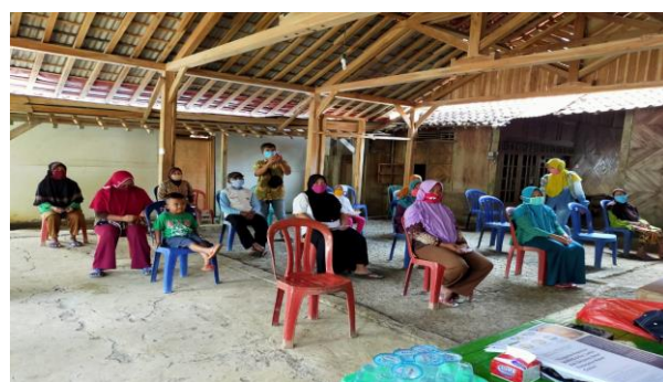
Gambar 4. Sosialisasi mengenai protokol kesehatan oleh pengurus BUMDes bersama Tim Pengabdian FISIP UNSOED

Fungsi sosial BUMDes sendiri telah disinggung dalam Permendesa PDTT Nomor 4 Tahun 2015 tentang Pendirian, Pengurusan, dan Pengelolaan, dan pembubaran BUMDes. Pada pasal 19 dijelaskan bahwa dua fungsi BUMDes yaitu fungsi ekonomi dan sosial. Dalam konteks pandemi COVID-19 yang memberikan dampak besar terhadap ekonomi masyarakat, BUMDes dapat memainkan peran bisnis sosialnya. Salah satunya adalah dengan menyelenggarakan pelayanan distribusi bantuan sosial dan mensosialisasikan protokol kesehatan kepada masyarakat desa (Gambar 4).