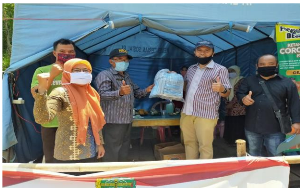
Gambar 5. Distribusi paket sembako dan alat pelindung diri (masker) kepada warga desa

Model kolaborasi lintas sektor ( cross-sector collaboration ) diterapkan dalam upaya penanggulangan dampak ekonomi COVID-19. Kolaborasi antara BUMDes dengan pemerintah desa terutama ditujukan untuk memberikan edukasi kepada warga terdampak terkait dengan social distancing , physical distancing , dan perilaku hidup bersih dan sehat. Kolaborasi juga melibatkan BUMDES, pemerintah desa dan satgas gugus COVID-19 dua desa dalam kegiatan penyaluran bantuan sosial kepada masyarakat desa.