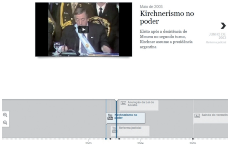
Figura 6. Timeline com infográfico interativo no especial do Estadão