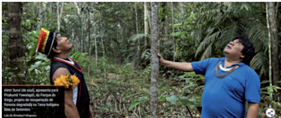
Figura 2. Slideshow da Folha onde uma imagem se transforma progressivamente em outra