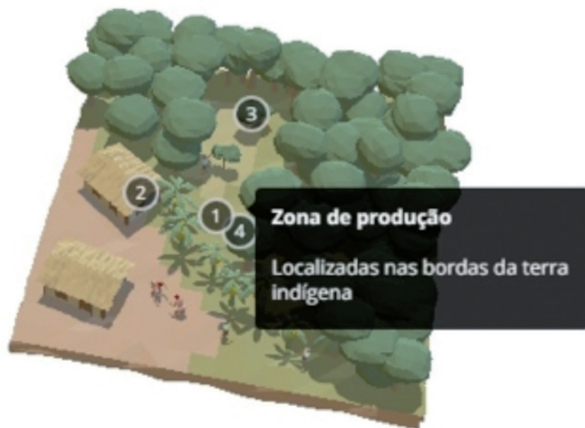
Figura 4. Infográfico interativo dinâmico em 3D utilizado no especial da Folha