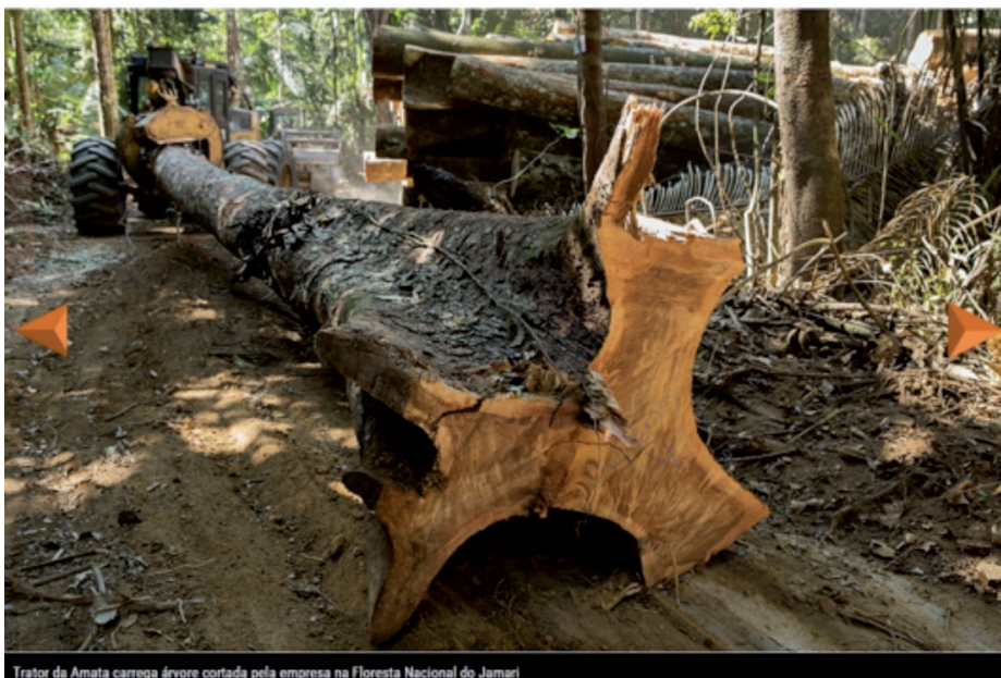
Figura 3. Reprodução do slideshow da Folha em que as fotos aparecem na horizontal