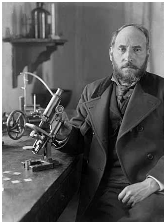
Figura 1. Don Santiago Ramón y Cajal [4].

Se dice que fue un niño muy travieso, hasta estuvo preso en la cárcel por tres días, por causar problemas a un vecino. Se destacó por su ilimitada curiosidad por toda la naturaleza