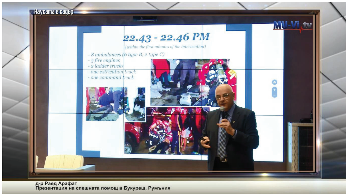
Фиг. 2. Лекция на проф. Раед Арафат за спешната помощ в Румъния - един от най-изтъкнатите експерти по природни бедствия, масови поражения и контртероризъм в света. През месец май тази година той бе удостоен с почетното звание „Доктор хонорис кауза" на Медицински университет- Варна.

Университетската телевизия става участник и в практическото обучение на бъдещите лекари с представянето на операции на живо, които се извършват и от хирурзи в Света Марина, и от гостуващи специалисти. Това е от първостепенна важност за студентите по медицина, които нямат възможност винаги да присъстват в операционите зали. По този начин те имат шанса да опознаят различни реални хирургични практики и методи за работа. Студентите получават достъп и до проведени и заснети семинари и практически занятия, които могат да гледат многократно (Фиг.3).