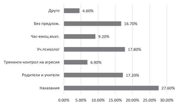
Фиг. 3. Предложения на учениците за справяне с агресията

Другите мерки, които се предлагат от малка част (4,6%) от изследваните са: въвеждане на оценка за поведение, проверки на входа на училище и провеждане на лекции/семинари по темата агресия (Фиг. 3).