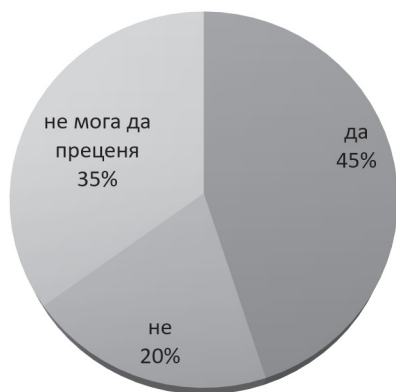
Фиг. 2. Убеденост на потребителите в пълната сертифицираност на козметичните продукти

Придружаващите даден продукт документи се съхраняват в Регионалната здравна инспекция (РЗИ). При проверка, при подаване на сигнали от потребители или възникнал здравословен проблем, веднага може да се направи справка. За всеки продукт трябва да има документи, които удостоверяват, че са спазени изискванията по отношение на състав, етикетиране, опаковки, условия и срок за съхранение, условия на предлагане, досие с информация и други специфични изисквания, посочени в съответните европейски и национални нормативни актове (5).