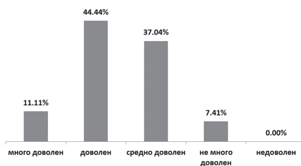
Фиг. 3. Степен за задоволност на фармацевти, от аптеката в която работят

Анализът на удовлетвореността от работното място показва, че по-голямата част от фармацевтите са доволни от аптеката в която работят – 44,4%, следвани от средно доволните –37,04%, като 7,4% не са много доволни. Резултатите са задоволителни (Фиг. 3).