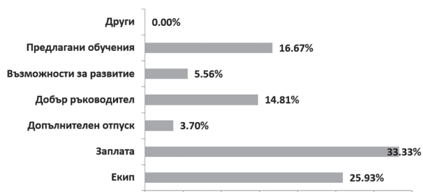
Фиг. 1. Мотивационни фактори

След обработването на анкетните карти, на въпроса какво най-много ги мотивира в работата, по-голямата част от анкетираните отговарят,