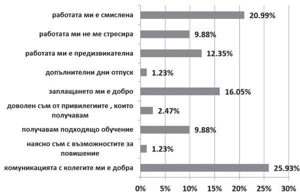
Фиг. 5. Фактори, които най-много влияят на удовлетвореността

85%, като тези, които нямат тази възможност, са едва 15%. Фармацевтите споделят, че често посещават обучения, свързани с представяне на нови лекарствени продукти, медицинска козметика, хранителни добавки, хомеопатия, както и семинари за продължаващо обучение, организирани от фармацевтични фирми от Регионална фармацевтична колегия (РФК).