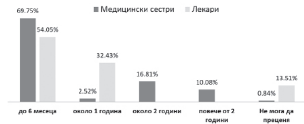
Фиг. 1. Мнение на анкетираниите медицински сестри и лекари за времето за адаптация към работата на медицинската сестра в диализна структура

За нас представляваше интерес мнението на медицинските сестри и лекарите относно времето, необходимо за адаптация към специфичността на дейността на медицинските сестри в хемодиализните отделения. Времеви интервали за адаптация на медицинската сестра към спецификата на работа в диализна структура условно могат да бъдат разделени на: „до 6 месеца“, „1 година“, „2 години“, „повече от две години“ и „не мога да преценя“ (Фиг. 1).