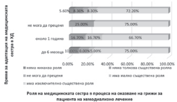
Фиг. 3. Мнение на анкетираните лекари за времето за адаптация към работата на медицинската сестра, в зависимост от позицията им за нейната роля в процеса на оказване на грижи за пациента на хемодиализно лечение

Резултатите от настоящото проучване показват, че времето за адаптация на медицинските сестри за работа в хемодиализна структура е в