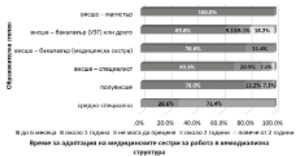
Фиг. 4. Време за адаптация на медицинските сестри за работа в хемодиализна структура според образователната им степен

обратна слаба корелационна зависимост от образованието им (Фиг. 4).