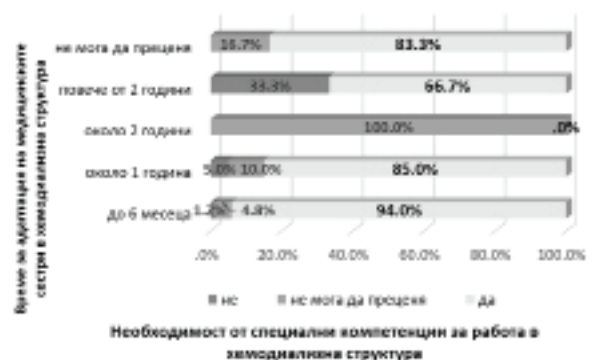
Фиг. 5. Взаимовръзка между времето за адаптация на медицинските сестри за работа в хемодиализна структура и мнението им за необходимостта от специфични компетенции

Доказана бе и статистически достоверна обратнопорпорционална умерена корелационна зависимост между времето за адаптация на диа-