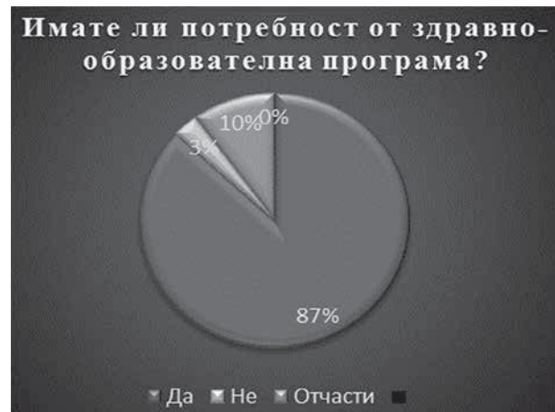
Фиг. 8. Разпределение на мнението на анкетираните относно необходимостта от въвеждане на здравно-образователна програма за формиране на сексуална култура

Интересен е фактът, че учениците са посочили, че тази здравно-образователна програма