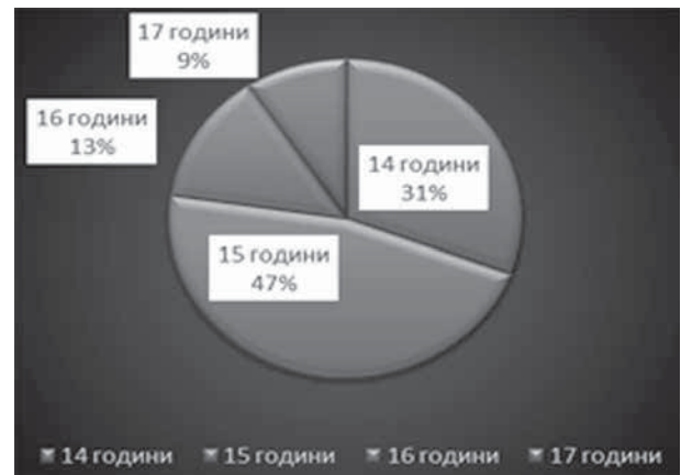
Фиг. 4. Разпределение на анкетираните според възрастта на половия им дебют

С най-висок относителен дял (47%) са осъществилите първия си сексуален контакт във възрастта 15 години, последиците от което могат да бъдат ранно забременяване и раждане, както и болести, предавани по полов път (фиг. 4). Тези данни съвпадат с проучване на Асоциацията по