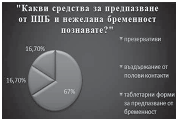
Фиг. 6. Разпределение на анкетираните според тяхната информираност относно средствата за предпазване от ранна бременност и полово предавани болести

точници за някои спорни аспекти на сексуалния живот. Основните източници, от които търсят информация анкетираните ученици за първия полов акт, за сексуалното общуване, за рисковете от ранното забременяване, начините за предпазване от бременности и болести предавани по полов път, са медии/интернет (15%), часове в училище – на класния ръководител и по биология (15%), от по-големи на възраст приятели (16%) и от семейството (12%). 47% от участниците са посочили отговор „от никъде“ (фиг. 7).