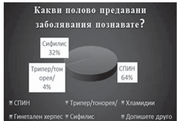
Фиг. 5. Разпределение на анкетираните според тяхната информираност относно полово предаваните болести

Дефицитът на познания относно болестите, предавани по полов път, е очевиден – само 64% от анкетираните са посочили, че познават полово предавани болести. Изследваните цитират като основни полово предавани болести СПИН, в 63,6 % от случаите, сифилис в 32,5% и трипер в 3,9% (фиг. 5).