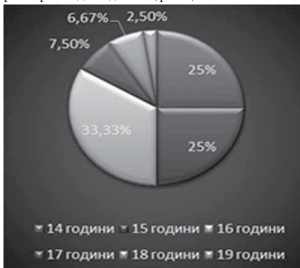
Фиг. 3. Разпределение на мнението на учениците относно възрастта за започване на полов живот

На въпроса „Според Вас каква е възрастта за започване на полов живот?“, след обработка на данните с най-голям относителен дял (33%) са анкетираните, които смятат, че това е възрастта 16 г., следвани от посочилите, че това е възрастта 14 г. и 15 г. (25%) и само 2,5 % смятат, че тази възраст трябва да бъде 19 г. (фиг. 3).