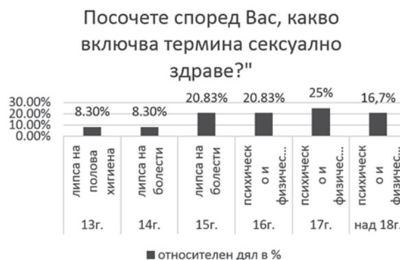
Фиг. 1. Разпределение на мнението на учениците, относно термина сексуално здраве

На въпроса „Посочете според Вас какво включва термина сексуално здраве?“, 62,5% са посочили психическо и физическо отсъствие на заболявания свързани със сексуалността, 29,13% от респондентите са посочили, че това е липсата на болести, свързани с половата система и само 8,3% са включили в отговора си и спазването на полова хигиена (фиг.1).