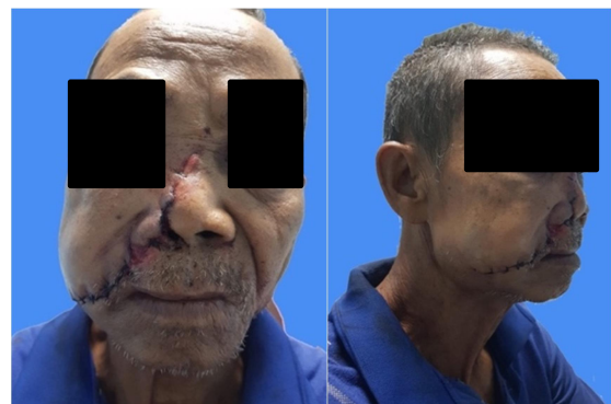
Gambar 1. Foto pasien pre operasi

Regio orbita dekstra ditemukan edema pada palpebra superior dan inferior, hipoestesi di kelopak mata bawah kanan, konjungtiva hiperemis, keterbatasan dan nyeri gerak bola mata ada dan jarak interkantus 31 mm. Regio orbita sinistra dalam batas normal. Regio dorsum nasal tampak luka jahitan sepanjang 25x10 mm, edema ada, krepitasi tidak ada, nyeri tekan ada, alignment tidak bisa dinilai. Regio zigoma dekstra dan sinistra dalam batas normal. Regio maksila dekstra dan sinistra dalam batas normal. Regio labialis dekstra tampak laserasi, edema ada, krepitasi tidak bisa dinilai, nyeri tekan ada. Regio labialis sinistra dalam batas normal. Regio mandibula dekstra tampak laserasi, edema ada, krepitasi tidak bisa dinilai, nyeri tekan ada. Regio mandibula sinistra dalam batas normal. Regio temporomandibular bilateral didapatkan dalam batas normal (gambar 1).