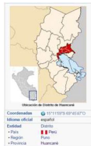
Figura 1. Ubicación geográfica

Situado a orillas del lago Titicaca al este de la laguna de Arapa. Limita por el norte con los distritos de Huatasani y de Inchupalla y también con la Provincia de San Antonio de Putina, Distrito de Pedro Vilca Apaza; por el sur con el lago; por el este con el Distrito de Vilque Chico; y por el oeste con el Distrito de Taraco y también con la Provincia de Azángaro, distritos de Chupa y de Samán, separados por la laguna de Arapa. ( https://munihuancane.wordpress.com/huancane/ , 2016)