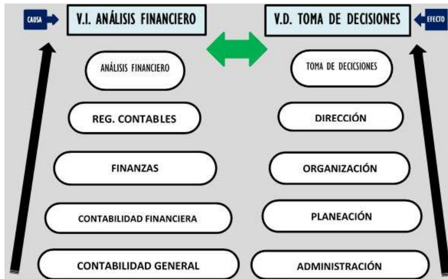
Figura 1: Superordenación Elaborado por: El Ejecutor