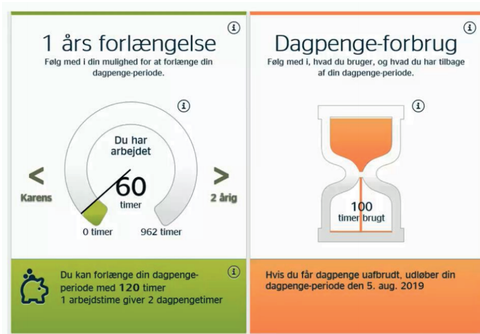
Figur 1. Dagpengetællerne på den lediges joblog viser optjening og forbrug af dagpenge

Dagpengekommisionen noterede, at den maksimale ydelsesperiode på to år i den daværende model ikke teoretisk kunne siges at tale til lediges nutidspræferencer (se Kvist, 2015 for en diskussion). Overlevelsesanalyser viste samtidigt, at ledige især forsvandt fra ledighed umiddelbart efter ledighedsstart og før ydelsesperiodens ophør, se Dagpengekommisionen (2015a). De mange midlertidige lappeløsninger og et kompliceret kontanthjælpssystem talte ikke til tabsaversionen. Hvordan kunne man aktivere tabsaversion og tale til nutidspræferencer tidligere? Svaret blev ved en ny brug af karensperioder.