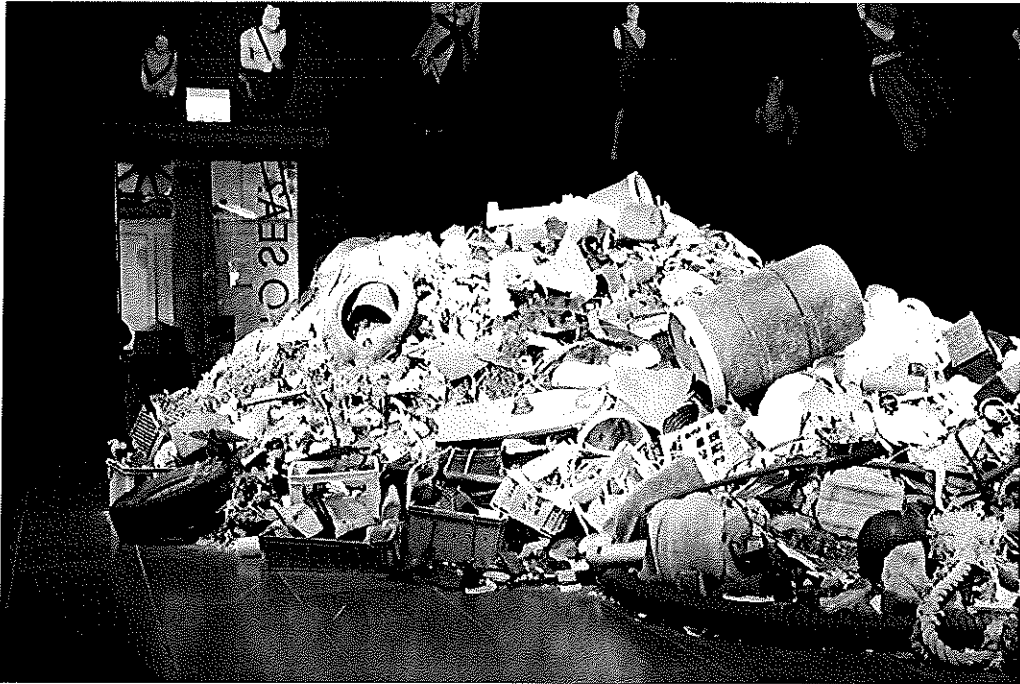
Fig. 2. Affaldsbjergets imponerende størrelse gør det nemt for de besøgende at forestille sig plastikproblemet størrelse. Det viser affald fra de ubeboede øer i Stillehavet. Foto: Lerke Johansen, 2014.

På gulvet mellem afdelingerne er der skabt en grafisk affaldsstime af stickers med silhuetter af plastikposer og flasker. Et af modulerne er et stort affaldsbjerg bygget af elementer fra plastik i havene, og er med sin imponerende fremtoning med til at visualisere problemets størrelse. Andre moduler illustrerer problemet gennem kunstneriske fortolkninger, for eksempel blyantstegninger af plastikflasker der er blevet delvist spist af havskildpadder. Flere moduler har videoer som virkemidler; videoer som viser alt fra animation af affaldets bevægelse med havstrømmen til uddrag af dokumentaroptagelser fra de berørte stillehavsøer. Desuden er der som indgang til udstillingen en stor montre, som relaterer problemet til lo-