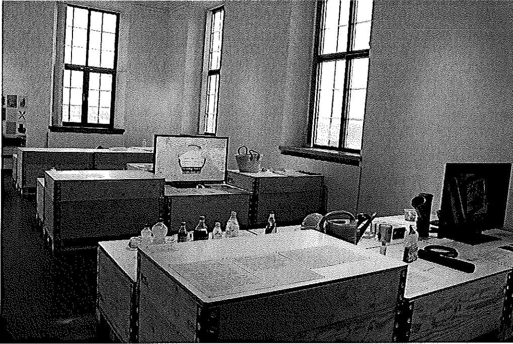
Fig. 3. Udstillingens lyse afdeling fokuserer på at formidle viden om plastiks egenskaber og anvendelsesmåder, og forsøger også at illustrere handlemuligheder. Den lyse afdelings videnskabelige formidling står i stærk kontrast til den mørke afdelings mere kunstneriske og følelsesmæssige formidling.

understreges, at der ikke tale om synlige øer af plastik, men snarere havområder med særlig høj koncentration af plastikdele.