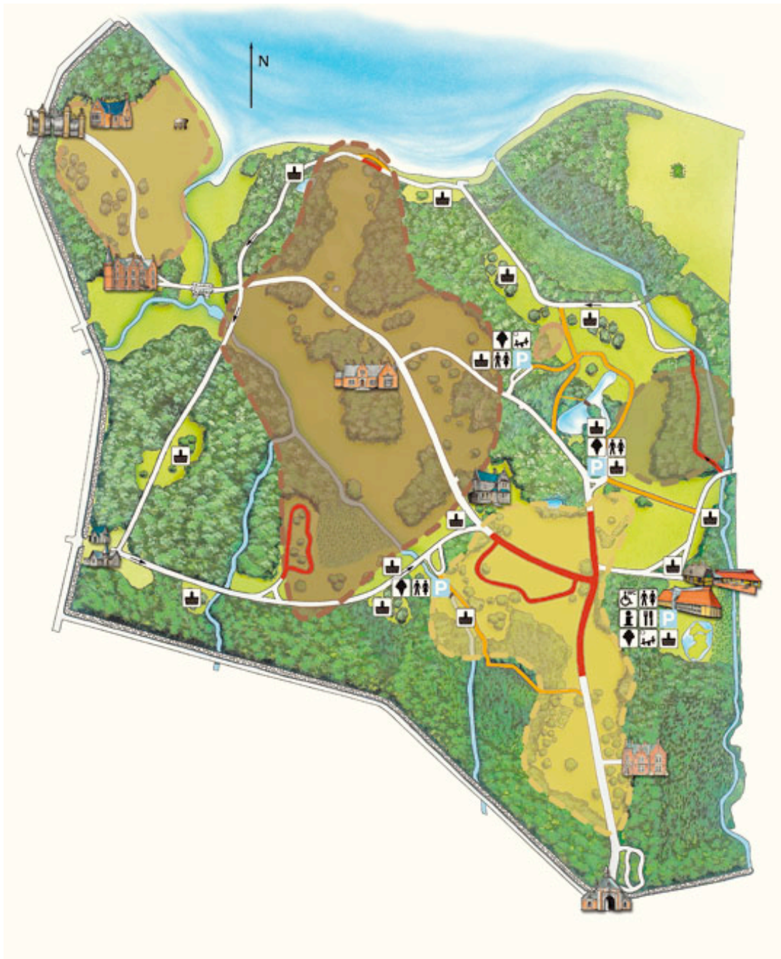
Plan af Knuthenborg Park og Safari

Undervejs har greven opsagt fredningsaftalen med staten, fordi safariparkens dyrehold ikke passede ind i fredningsbestemmelserne. Godset skaffer derimod helt andre og større entreindtægter til parkens drift. Parken drives ved siden af godsets landbrug, Bandholm havn og de mange ejendomme, som hører til. Skønt landbruget er mindre i beskæftigelse, er det på flere måder en mere stabil del af Knuthenborgs samlede økonomi end parken. Knuthenborg Park og Safari ligger i direkte forlængelse af den historiske dominans af godsdrift i landbruget på Lolland, og det ligger også i forlængelse af traditionerne, at initiativet kommer fra herremanden. Men samtidig skiller Knuthenborg sig tidligt ud som et første, stort og markant privat turistinitiativ, med egen produktudvikling og internationale forbindelser, på Lolland. Egeskov og Givskud løvepark kan hver især beslægtede ting men ikke i den kombination og fælles ramme, som findes i Knuthenborg Park og Safari. Det er en attraktion med lang rækkevidde, og