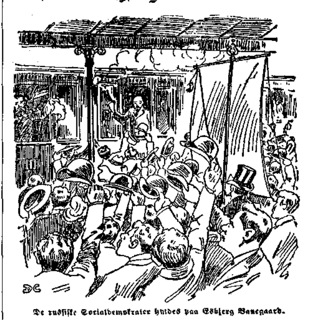
De russiske Socialdemokrater hvides paa Esbjerg Banegaard.