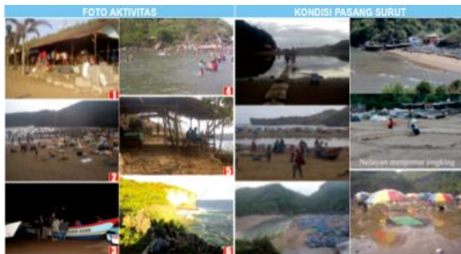
Gambar 6. Foto aktivitas area 4

Terjadi konflik antara pengunjung yang bersantai duduk lesehan menggunakan tikar dengan nelayan yang melabuhkan perahunya dan merapikan jalan. Adanya fenomena alam juga mempengaruhi aktivitas pengunjung yaitu berupa air laut pasang sehingga menyebabkan para pengunjung tidak ada yang duduk bersantai di pantai. Kemudian saat pantai terbelah menjadi dua, para nelayan memiliki pekerjaan sampingan yaitu menyeberangkan para pengunjung. Pada saat gelombang tinggi sehingga tidak memungkinkan bagi para nelayan melaut, mereka mencari jingking (sejenis kepiting kecil) di area pantai.