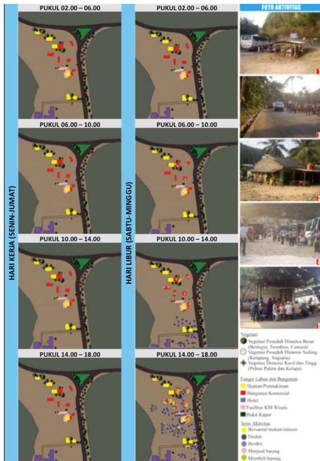
Gambar 2. Sistem aktivitas area 1

Intensitas pengunjung terlihat sangat berbeda pada saat hari libur, dengan memanfaatkan lahan kosong yang pada hari lain tidak dimanfaatkan sebagai area parkir kendaraan. Hal ini juga menyebabkan intensitas pedagang yang berjualan di warung serta pemanfaatan area toilet dekat lahan kosong tersebut juga meningkat.