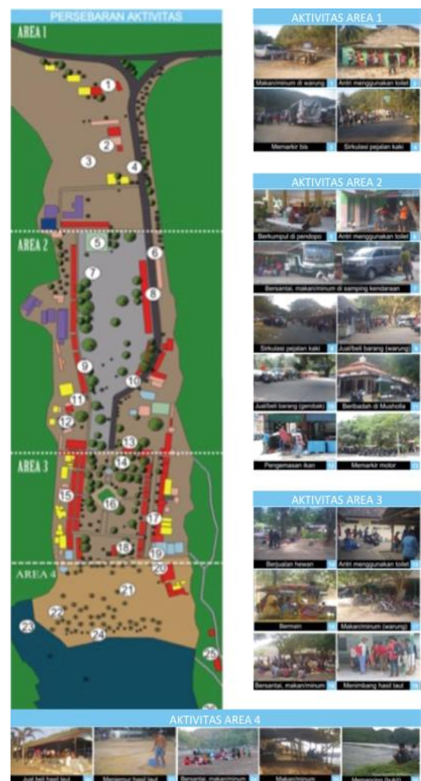
Gambar 1. Data persebaran aktivitas