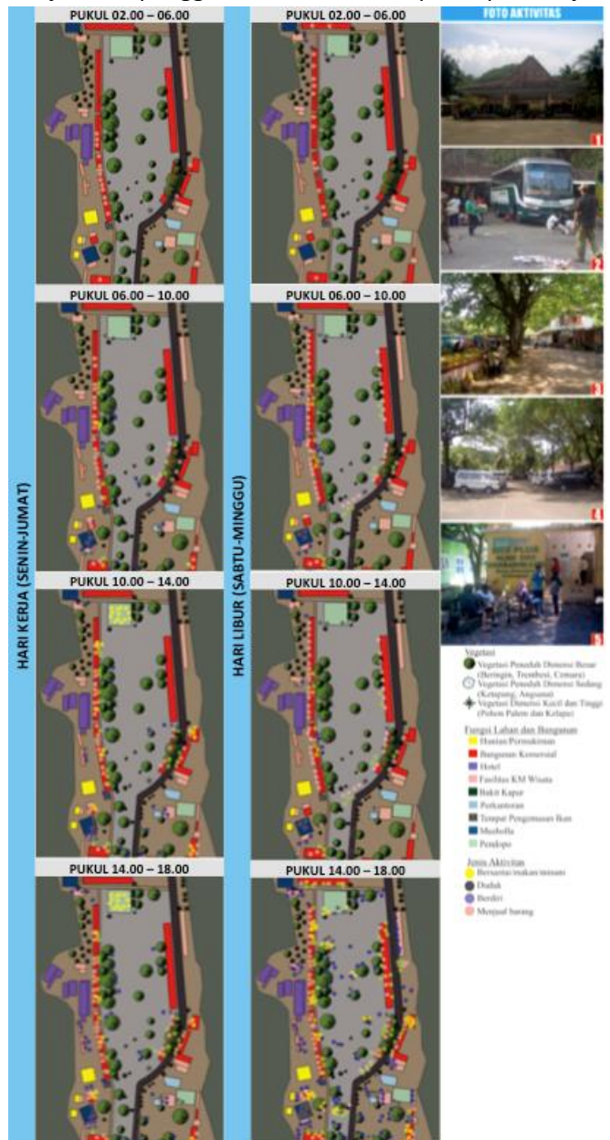
Gambar 3. Sistem aktivitas area 2

Adanya peningkatan jumlah pengunjung menyebabkan peningkatan pemanfaatan area parkir, tempat berjalan, penggunaan toilet dan pendopo. Terjadi