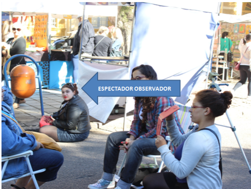
Figura 2 - Espectador observador. Converso sobre teatro 2, 2014.

Desta forma, a terceira camada é chamada de espectador-colaborador , pois ele intervém na performance e compõe a cena no instante presente em parceria com o artista, se coloca em risco e se insere na obra, dissolvendo a barreira que separa artista e espectador. Porém, para Rancière (2010), colocar-se em situação de colaboração não torna o espectador mais ativo, mas sim torna o espectador parte constituinte da performance, indispensável naquele ato. Visto que a condição de espectador já é ação, conforme o autor esclarece: