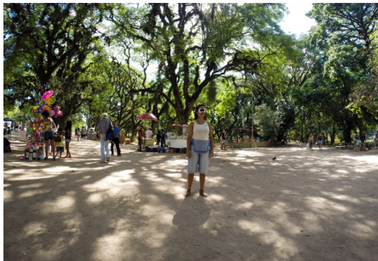
Figura 3 - O que eu não vejo, mas desejo ver, 2015.

Não havia naquele instante, do ato performativo, nada além do que o tom de voz de quem falava e o toque das mãos de quem me conduzia pelo parque, nada mais do que presença partilhada e afeto. Sendo assim, os julgamentos visuais nesse encontro estavam excluídos para mim, abrindo espaço para uma outra forma de relação com o outro e também para a imaginação, numa transmutação perceptiva através desse estado efêmero criado naquele instante, representado por Caballero (2011, p. 47):