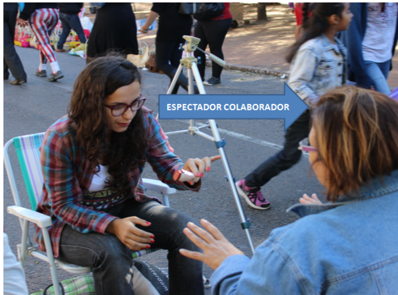
Figura 3 - Espectador colaborador. Converso sobre teatro 2, 2014.

Sob esta ótica estabelecemos três níveis de aproximação e relação do espectador na performance, conforme ilustrada a seguir: