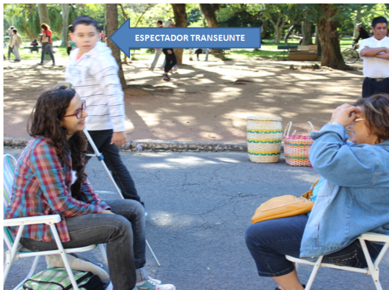
Figura 1 - Espectador transeunte. Converso sobre teatro 2, 2014.

Já o espectador observador integra uma segunda camada, porque ele suspende a caminhada e desta forma vê o acontecimento amplamente, acompanha a proposta da performer e percebe a tomada de posição (Fabião, 2008) do espectador-colaborador ao aceitar o convite à experiência. Todavia, ele ainda está distante, não se coloca em risco e sua principal ação, assim como a do espectador transeunte, é olhar, com a diferença que o espectador observa a continuidade e desenvolvimento da ação. Ambos os espectadores (transeunte e observador) já estão em uma condição de emancipação, já que o olhar/ver são formas ativas do espectador se colocar na cena, segundo Rancière (2010, p. 115): “Ela começa quando nos damos conta de que olhar também é uma ação que confirma ou modifica tal distribuição, e que ‘interpretar o mundo’ já é uma forma de transformá-lo, de reconfigurá-lo.”