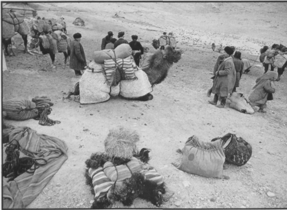
Hierboven: Aan de westzijde van het Pamir-gebergte, bij de 'Stenen Toren', ontmoetten handelslieden uit Oost en West elkaar.