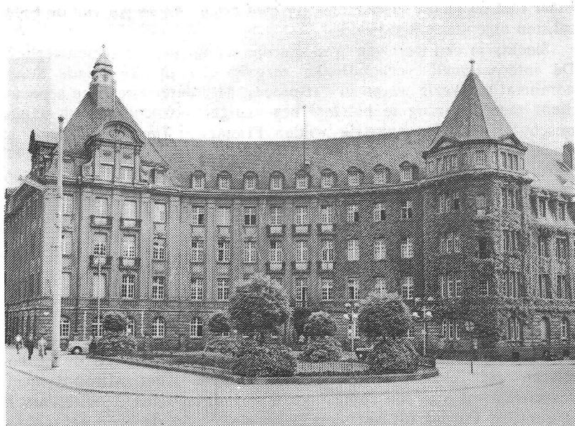
Gebouw van de Hoge Autoriteit aan de Place de Metz in Luxemburg (Bureau Nederland van de Commissie van de Europese Gemeenschappen, Den Haag)