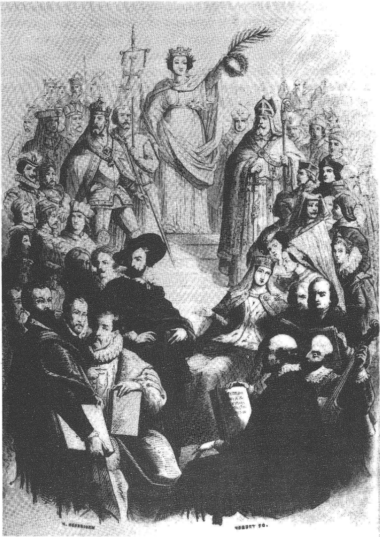
'La Belgique couronnant ses enfants illustres': het Belgische pantheon, met - gegroepeerd - de schrijvers en geleerden, de schilders, de politici en militairen, de religieuzen, de vrouwen en de musici (uit: A. van Hasselt, Biographie nationale. Vie des hommes et femmes illustres de la Belgique, depuis les temps les plus reculés jusqu'à nos jours (Brussel 1853) deel 1)