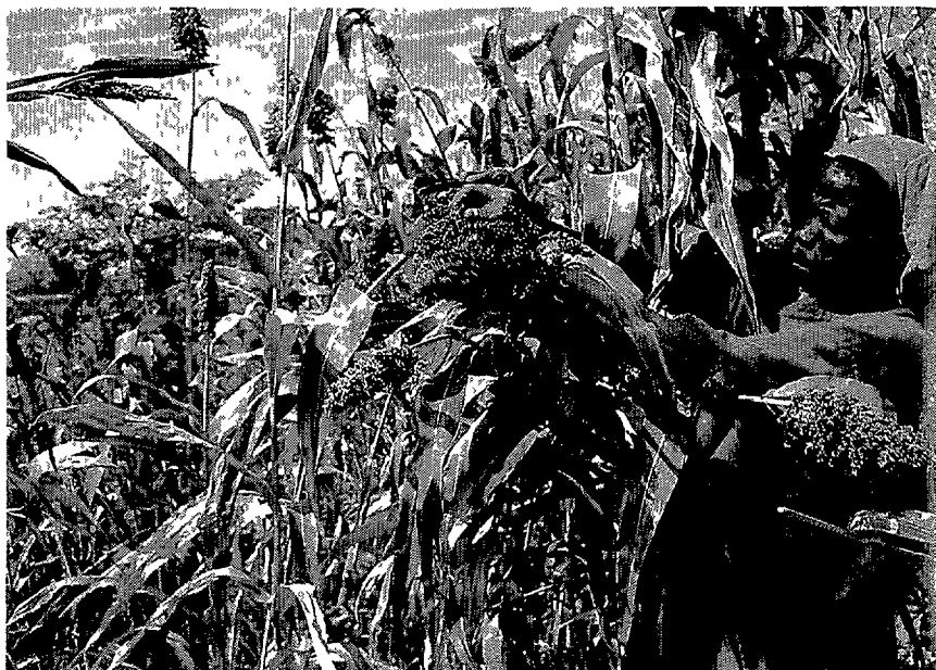
Het oogsten van sorghum te Tireli

De veeteelt biedt geen veilige variant vanwege periodieke droogten die gepaard gaan met aanzienlijke verliezen van vee en dus met instorting van de markt 3 . Sinds 1975 heeft deze ramp zich twee maal voorgedaan en de landbouweconomie voor jaren verlamd. Bovendien heeft zij een grondige wijziging veroorzaakt in het eigendom: kleine familiebedrijven zijn gezwicht voor zakenlieden uit de stad en voor ambtenaren 4 .