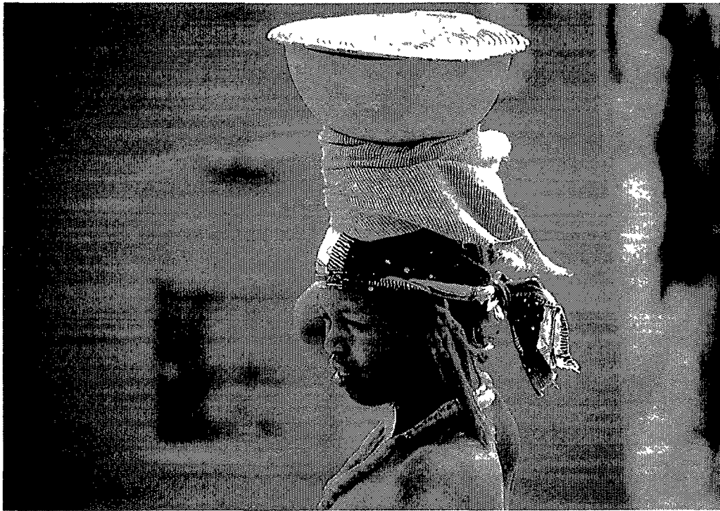
Peul melkverkoopster te Tireli (foto G. Jansen 1983)

strategie is alleen maar in het centrum van het plateau voldoende en van daaruit langs de aanvoerwegen naar Sangha, Dourou en Bankas. Tussen 1974 en 1987 zijn er 66 dammen gebouwd 14 , zodat er nu 863 ha kan worden bevoeid, waarvan 70.000 tuinbouwers profiteren; elke tuinbouwer heeft dus 125 m 2 tot zijn beschikking. Dit is geen levensvatbare onderneming, noch om het hoofd te bieden aan het graantekort, noch om het inkomen op langere termijn te verhogen. Niettemin heeft de tuinbouw op deze kleine percelen de productie van de voornaamste voedingsmiddelen vervangen. In sommige gevallen is er een belangrijke specialisatie ontstaan, bijvoorbeeld de vrouwen van een bepaald dorp hebben veel succes behaald met de productie van zaailingen zodat de uientelers nu hun bestellingen bij die vrouwen doen 15 . In de streek van Sangha zijn er gezinnen die voor hun inkomen zich meer baseren op uienteelt dan op graanbouw.