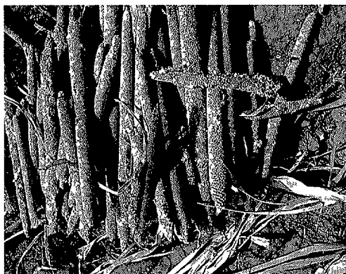
Geogste gierst te Tireli

De maatschappelijke structuur van de bevolkingsgroepen is heel verschillend 5 . De Dogon zijn ingedeeld op basis van 'lineages' waarbij de positie en de sekse de voornaamste criteria vormen. In enkele gevallen speelt de status (vrije man tegenover slaaf) ook een grote rol. Bij de Peul is de politieke ongelijkheid, verankerd in hun hiërarchie, belangrijk wanneer het erom gaat de status van iemand, zijn maatschappelijke positie en zijn beroep vast te stellen. Die kenmerken zijn essentieel om te begrijpen hoe de mensen de grond exploiteren en in hun onderhoud voorzien. De politieke en economische ongelijkheid plaatst de mensen in een positie die structureel verschillend is met betrekking tot allerlei risico's van hun omgeving 6 .