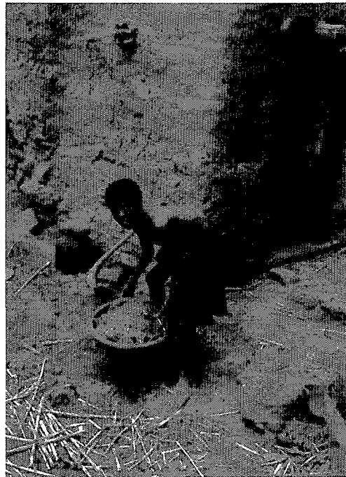
Het verzamelen van mest op een erf te Banani

Het Plateau van Bandiagara vormt een tamelijk moeilijk productiegebied. Officieel bestaat een derde ervan uit kale rots maar in werkelijkheid is dat veel meer. Nog een derde deel bestaat uit verschillende bodemsoorten met een diepte van niet meer dan 10 cm. Bovendien zijn de meeste bodems onderhevig aan seizoensdroogte vanwege die dunne laag of fysieke eigenschappen 7 . De bevolkingsdruk is hoog met ongeveer 25 inwoners per km 2 of 190 000 inwoners voor het hele district Bandiagara in 1991 8 . Om in hun levensonderhoud te voorzien hebben deze mensen slechts 48 000 ha bouwland (6,3% van het geheel) 9 . Op grond van de bodemvruchtbaarheid en de potentiële productie (tussen 300 en 800 kg/ha) is de graanbouw niet voldoende om de bevolking te voeden. Tussen 1976 en 1987 heeft een uittocht van 30 000 inwoners een vermindering van de bevolking